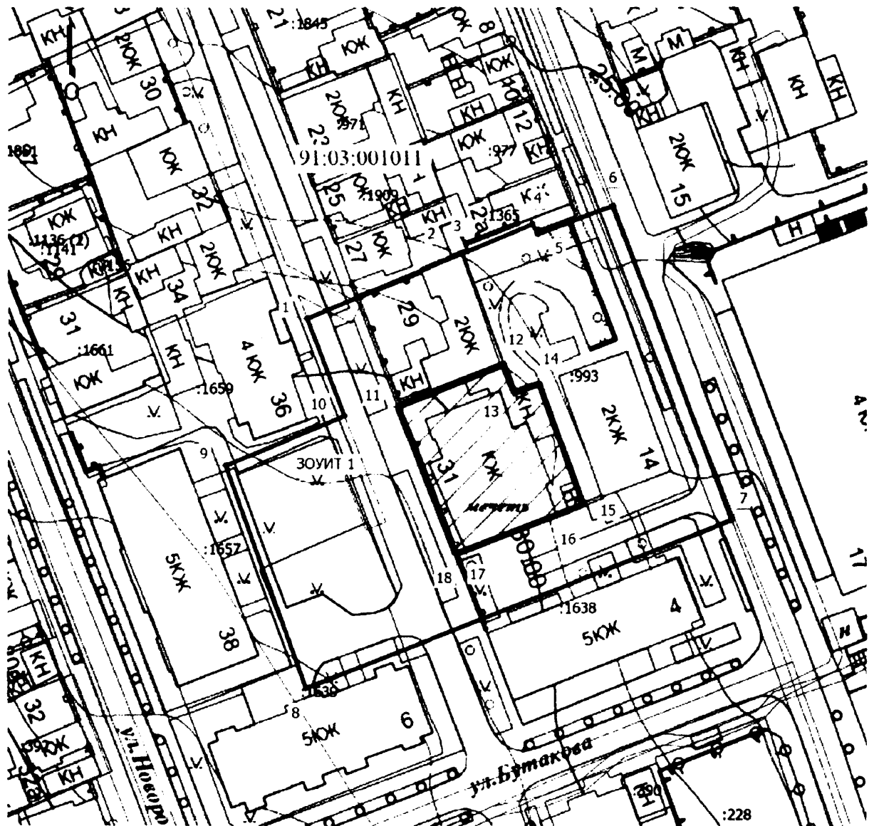
Схема характерных (поворотных) точек плана границ зоны регулирования застройки и хозяйственной деятельности объекта культурного наследия (ЗРЗ)