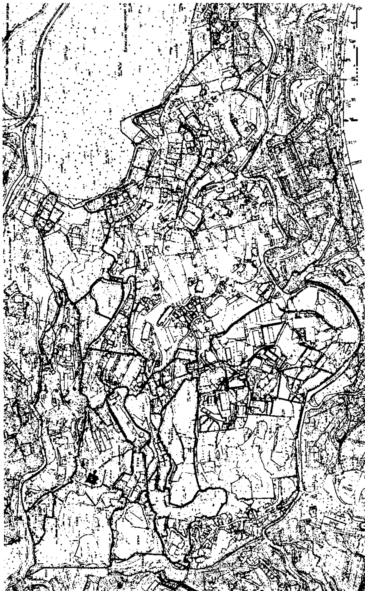
Схема границ объединённой зоны охраны объектов культурного наследия