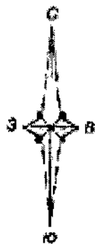
Схема границ территории