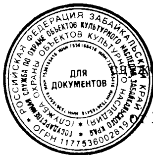
СХЕМА ГРАНИЦ ЗОН ОХРАНЫ ОКН «ДОМ ДОХОДНЫЙ КУЛАЕВА», РАСПОЛОЖЕННОГО ПО АДРЕСУ: ЗАБАЙКАЛЬСКИЙ КРАЙ, Г. ЧИТА, УЛ. АНОХИНА, Д. 48. М 1:1000