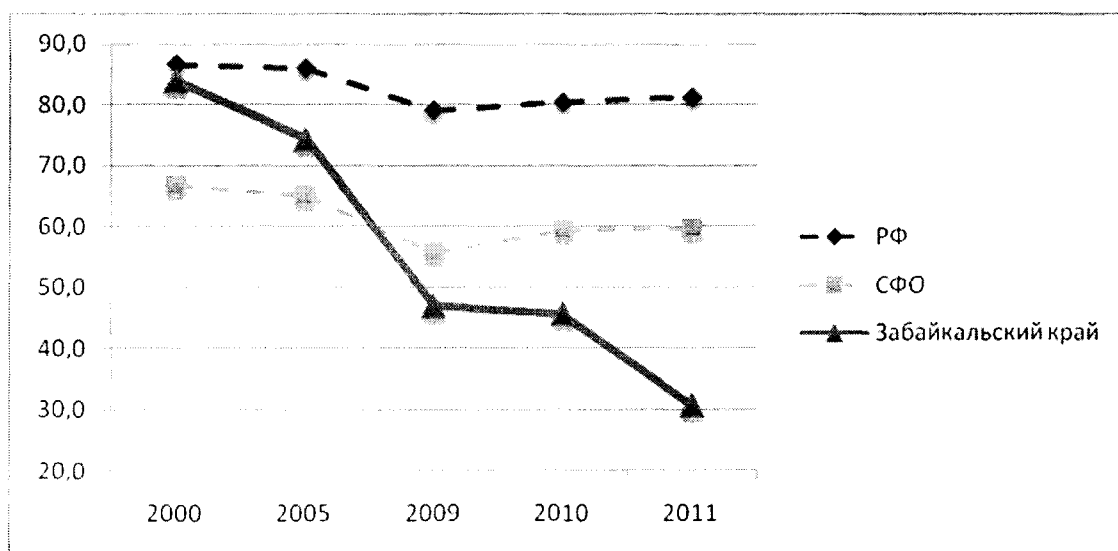
Рис.2. Доля расходов на прикладные исследования и разработки в общем объеме внутренних текущих затрат на научные исследования и разработки, % (по данным Росстата)

В структуре внутренних текущих расходов на научные исследования, проводимые в крае, превалируют (составляют практически 70 %) расходы на фундаментальные исследования. В то же время доля расходов на прикладные исследования и разработки, в большей степени приближенные к практическому внедрению, неуклонно снижается (рис.2), что в краткосрочной перспективе, отдаляет науку от производства.