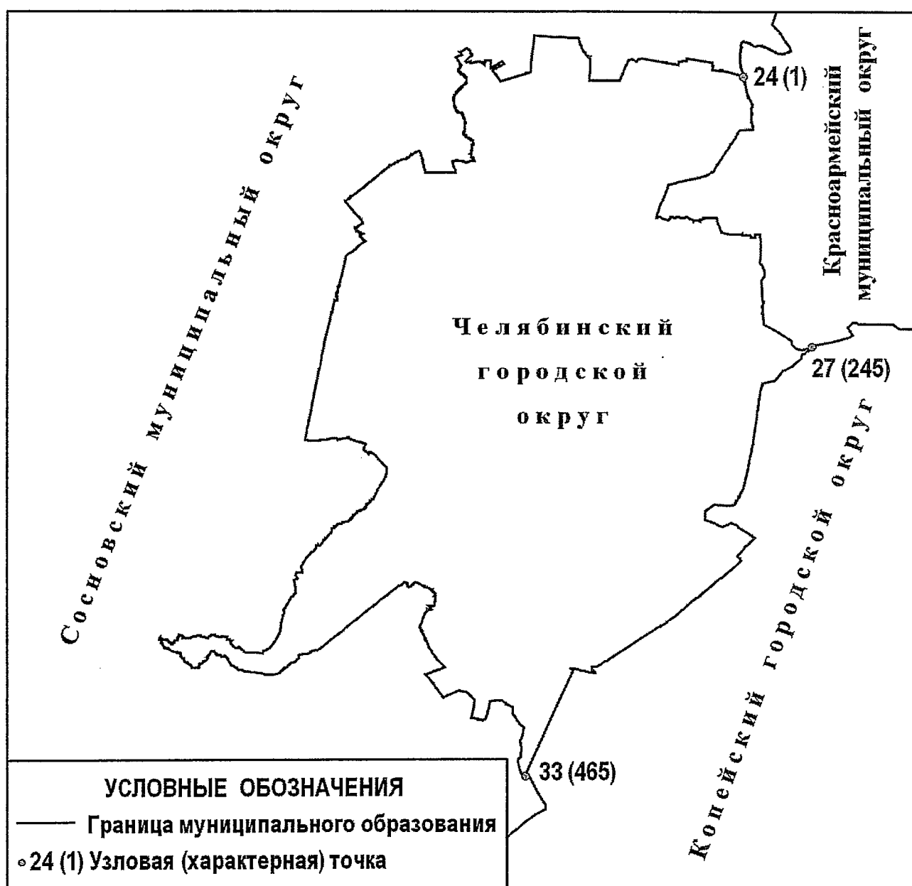
СХЕМА ГРАНИЦ Челябинского городского округа

«Приложение 2 к Закону Челябинской области «О статусе и границах Челябинского городского округа»