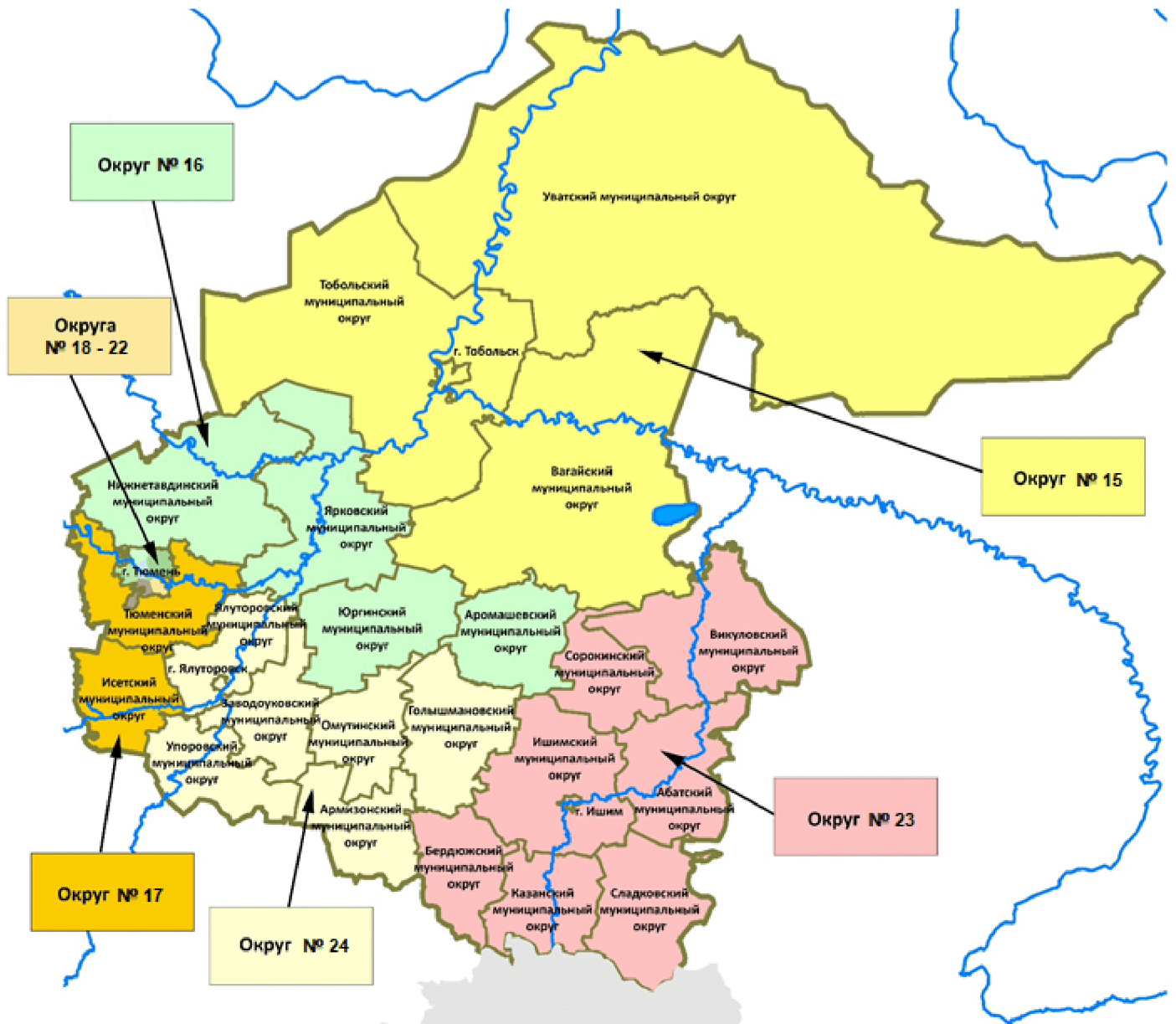
Схема одномандатных избирательных округов в Тюменской области для проведения выборов депутатов Тюменской областной Думы