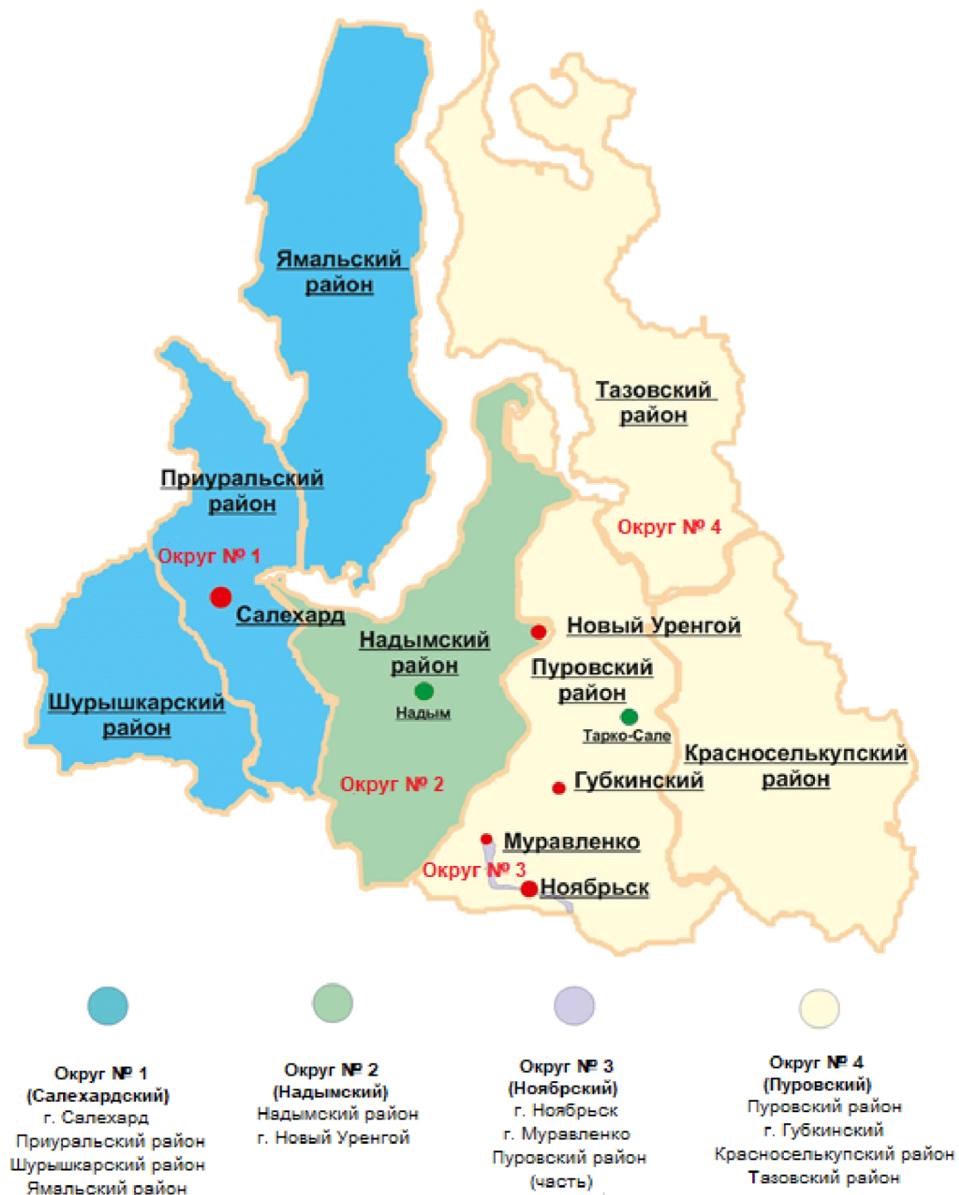
Схема одномандатных избирательных округов в Ямало-Ненецком автономном округе для проведения выборов депутатов Тюменской областной Думы