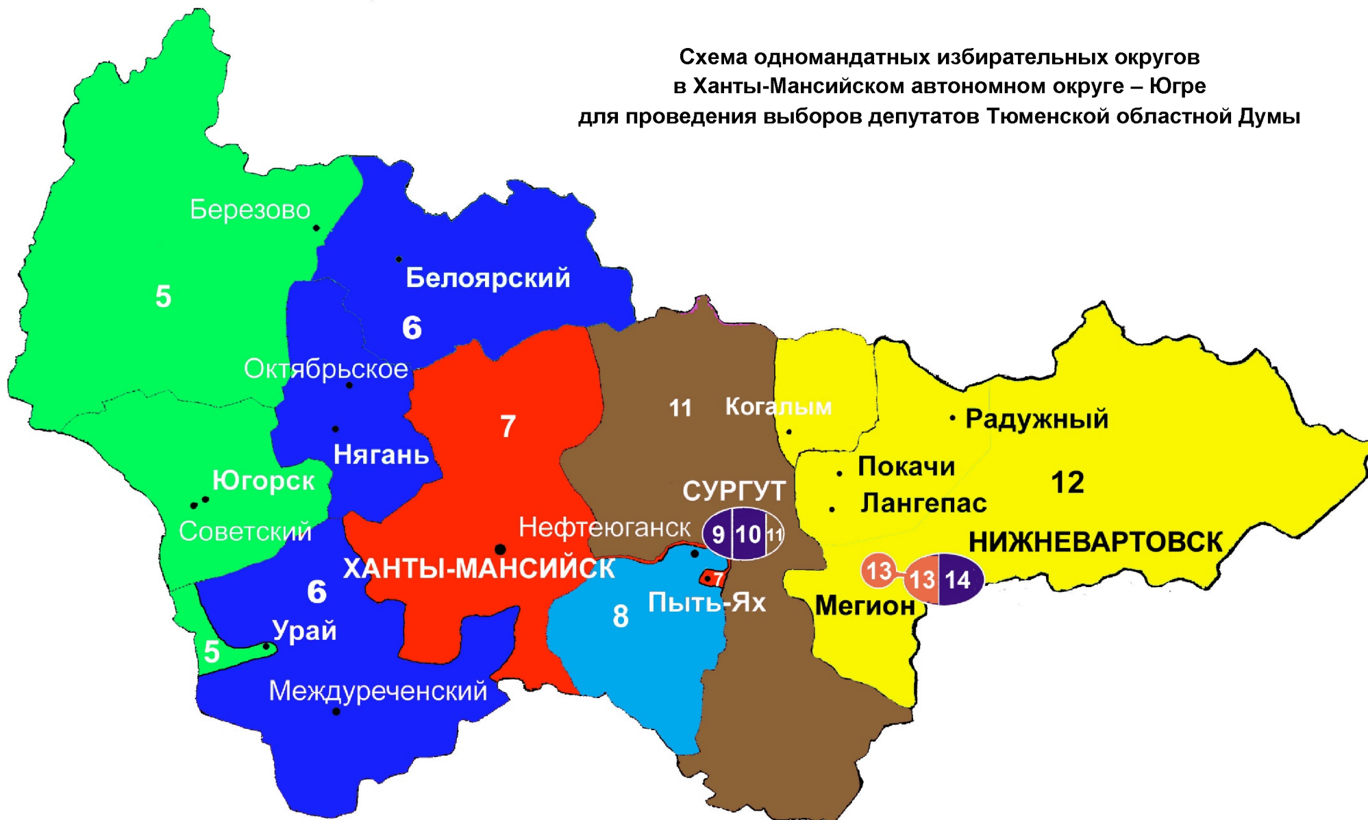
Схема одномандатных избирательных округов в Ханты-Мансийском автономном округе – Югре для проведения выборов депутатов Тюменской областной Думы