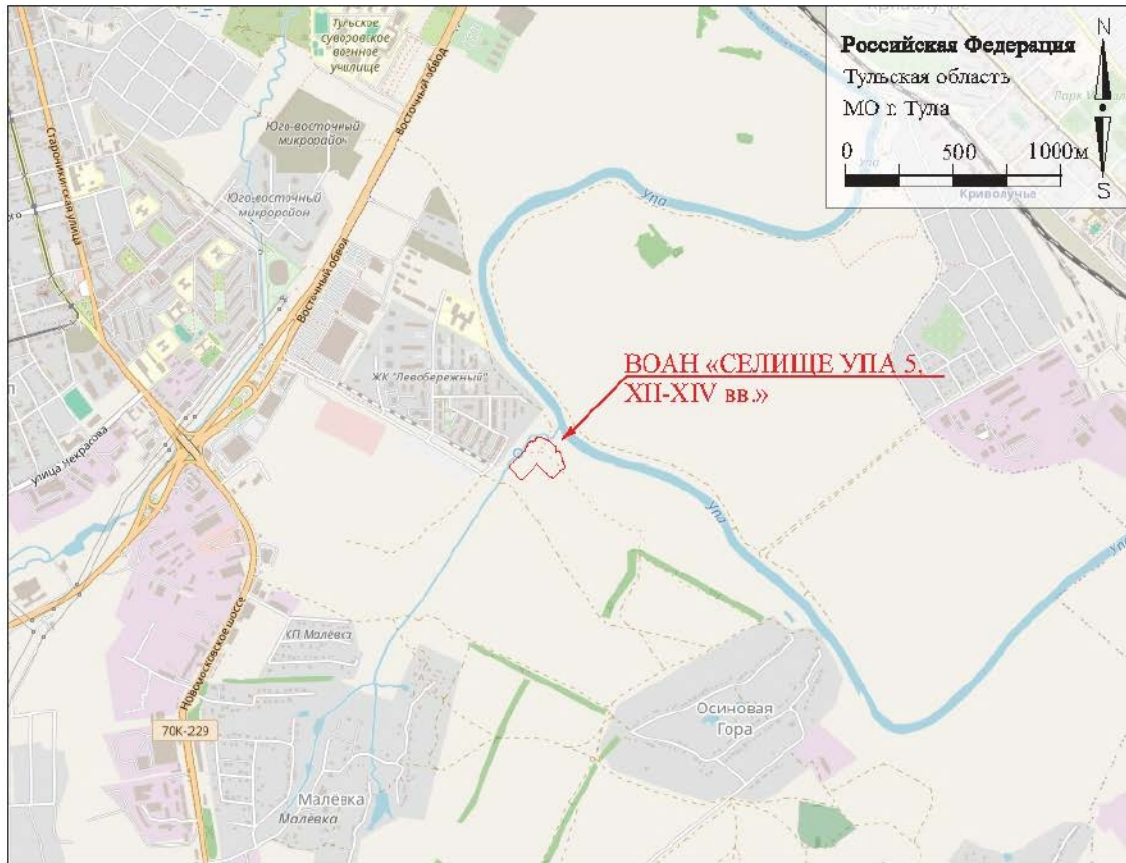
Рис. 2. ВОАН «СЕЛИЩЕ УПА 5, XII-XIV вв.». 2025 г. Ситуационный план ВОАН «СЕЛИЩЕ УПА 5, XII-XIV вв.».