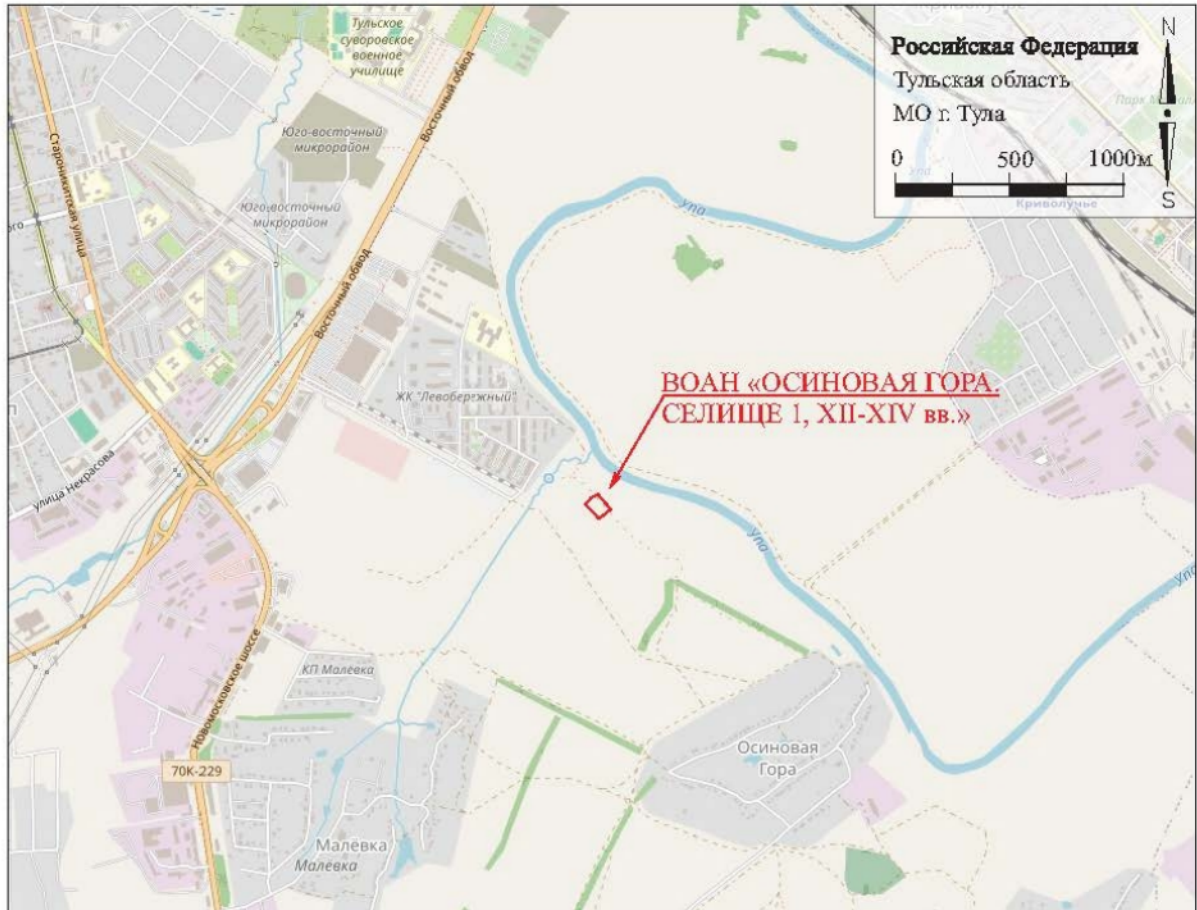
Рис. 2. ВОАН «ОСИНОВАЯ ГОРА. СЕЛИЩЕ 1, XII-XIV вв.». 2025 г. Ситуационный план ВОАН «ОСИНОВАЯ ГОРА. СЕЛИЩЕ 1, XII-XIV вв.».