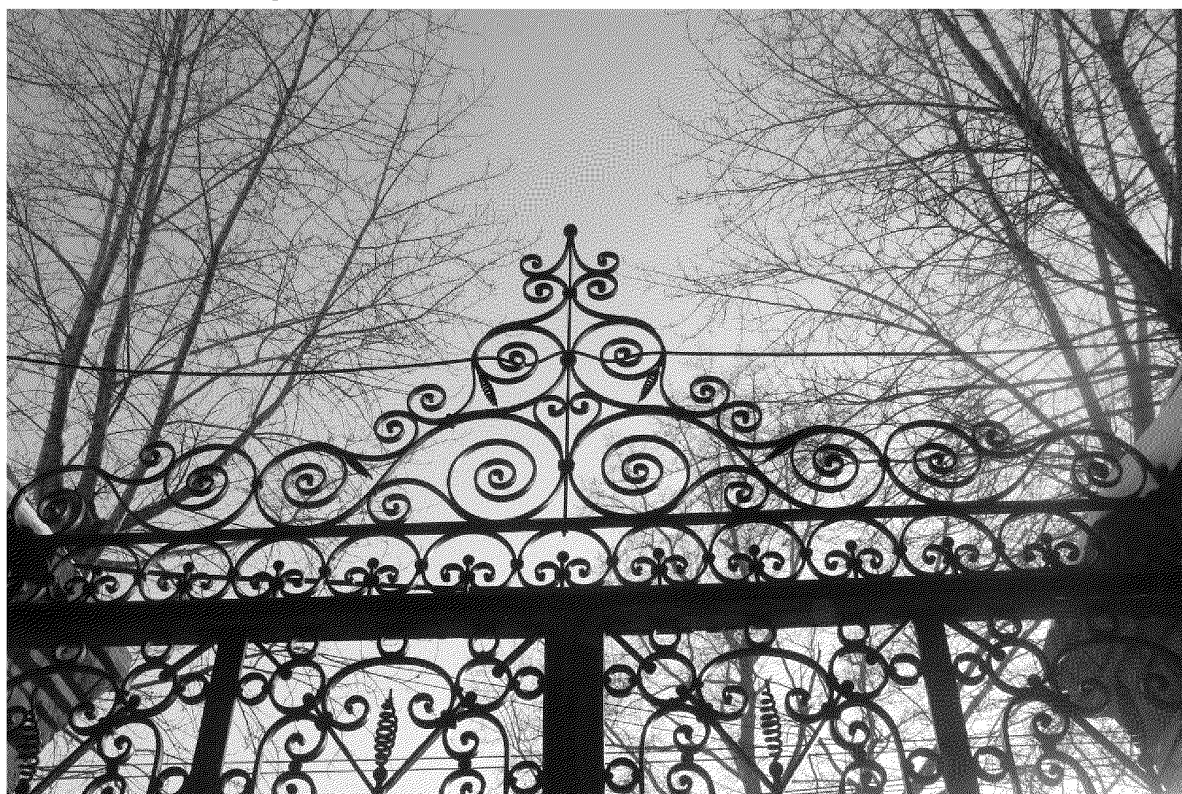
Видовая точка № 9 Решетка перемычки проема ворот