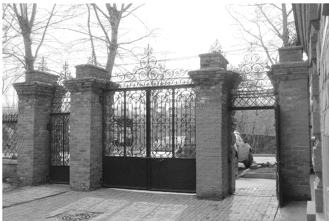
Видовая точка № 2. Северный фасад ворот, вид со двора