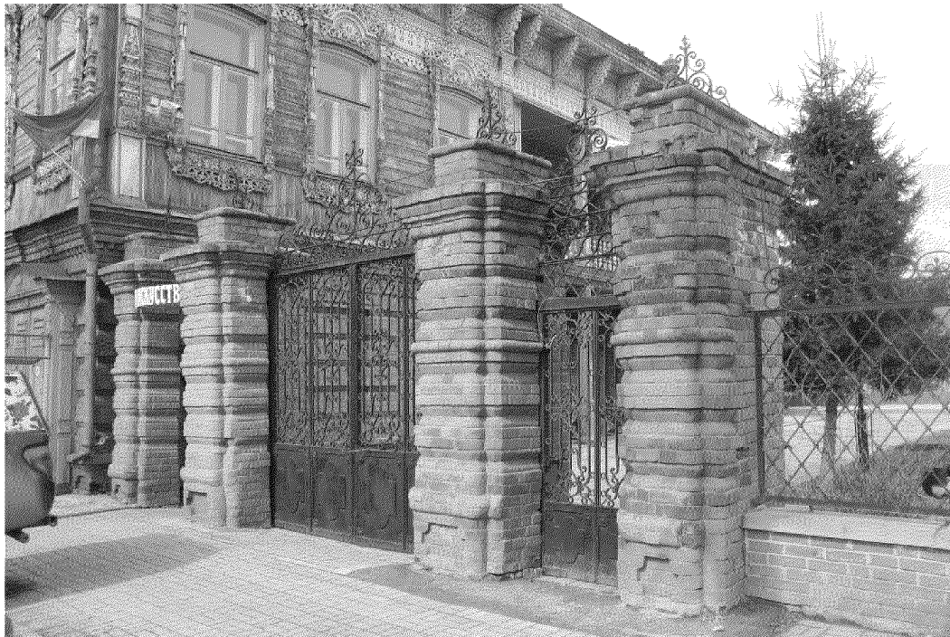
Видовая точка № 1. Южный фасад ворот, вид с ул. Шишкова

дата съемки: 08.04.2025 г.