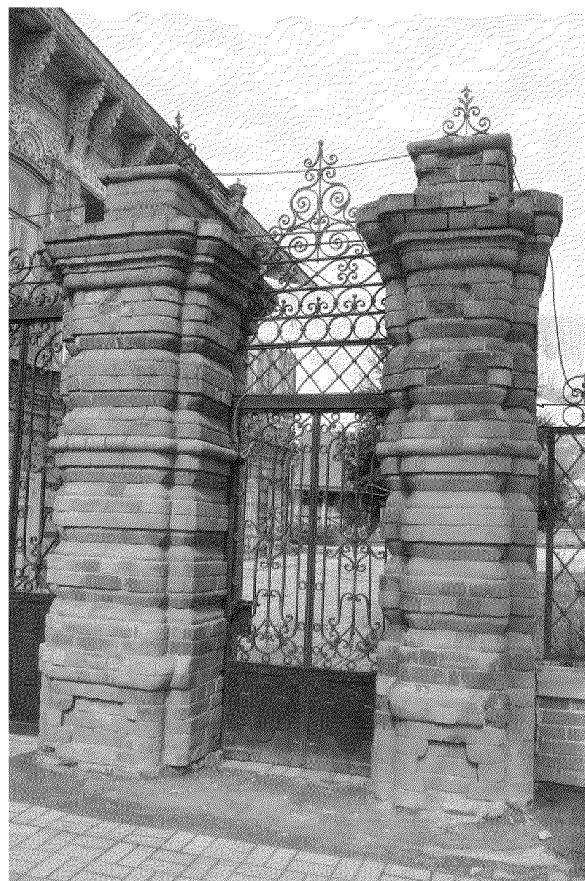
Видовая точка № 8 Левая калитка