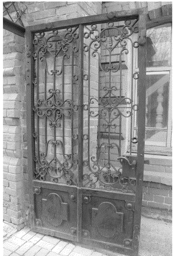
Видовая точка № 6 Правая калитка (металл,ковка)