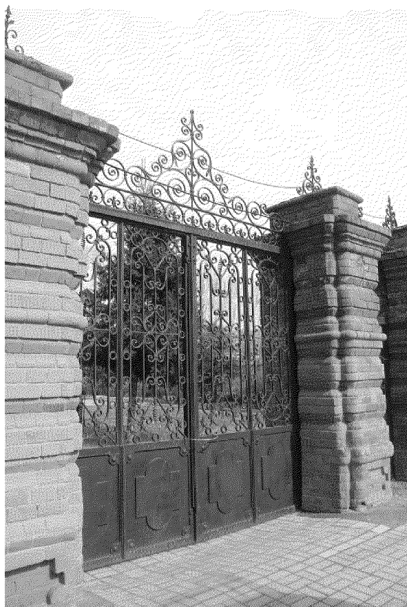
Видовая точка № 7 Ворота