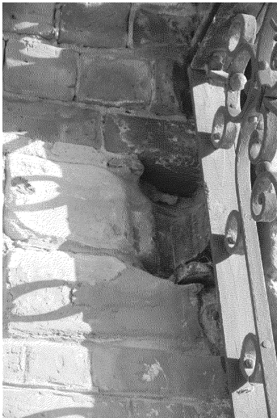
Видовая точка № 5 Фрагмент крепления ворот