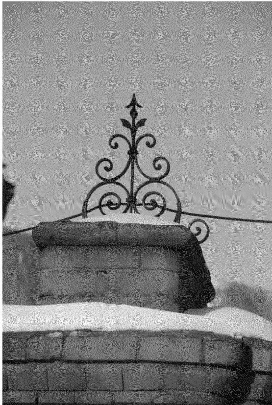
Видовая точка № 3 Фрагмент навершия столба ворот