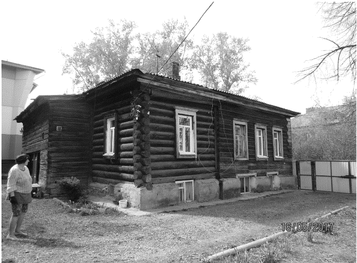
Видовая точка № 3. Боковой (северный) фасад. (, дата съемки: 16.05.2017 г.)