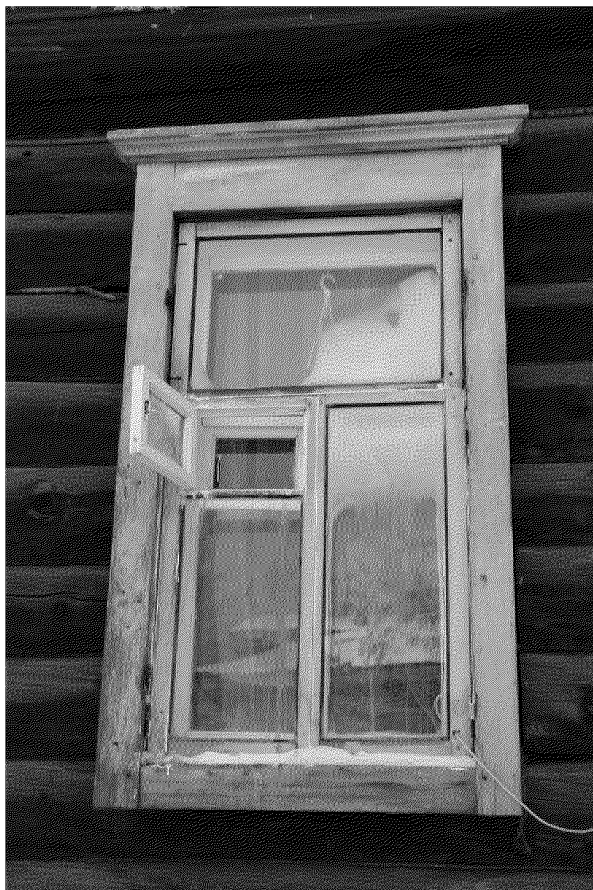
Видовая точка № 7. Наличник окна бокового фасада