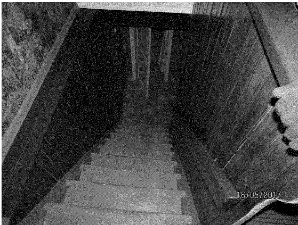
Видовая точка № 9. Деревянная лестница спуска в подвал