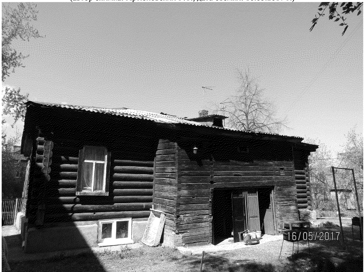
Видовая точка № 4. Дворовый (восточный) фасад.