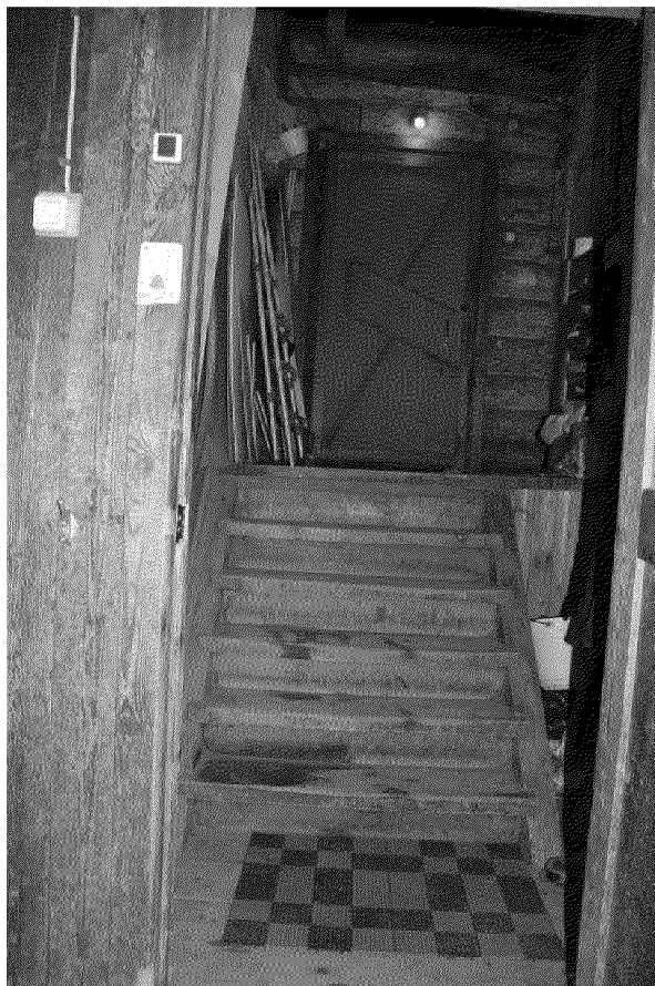
Видовая точка № 8. Деревянная лестница дворового ризалита