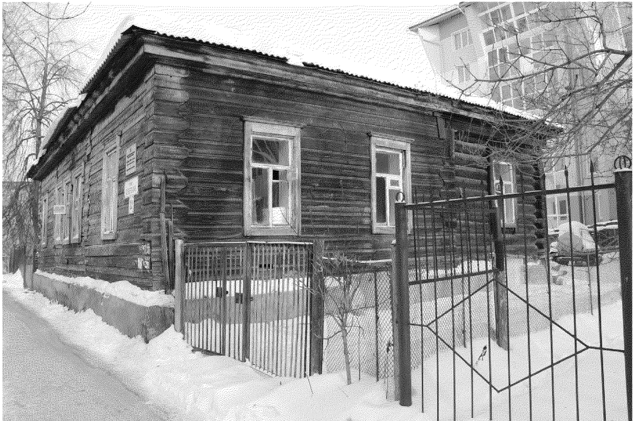
Видовая точка № 5. Фрагмент главного фасада