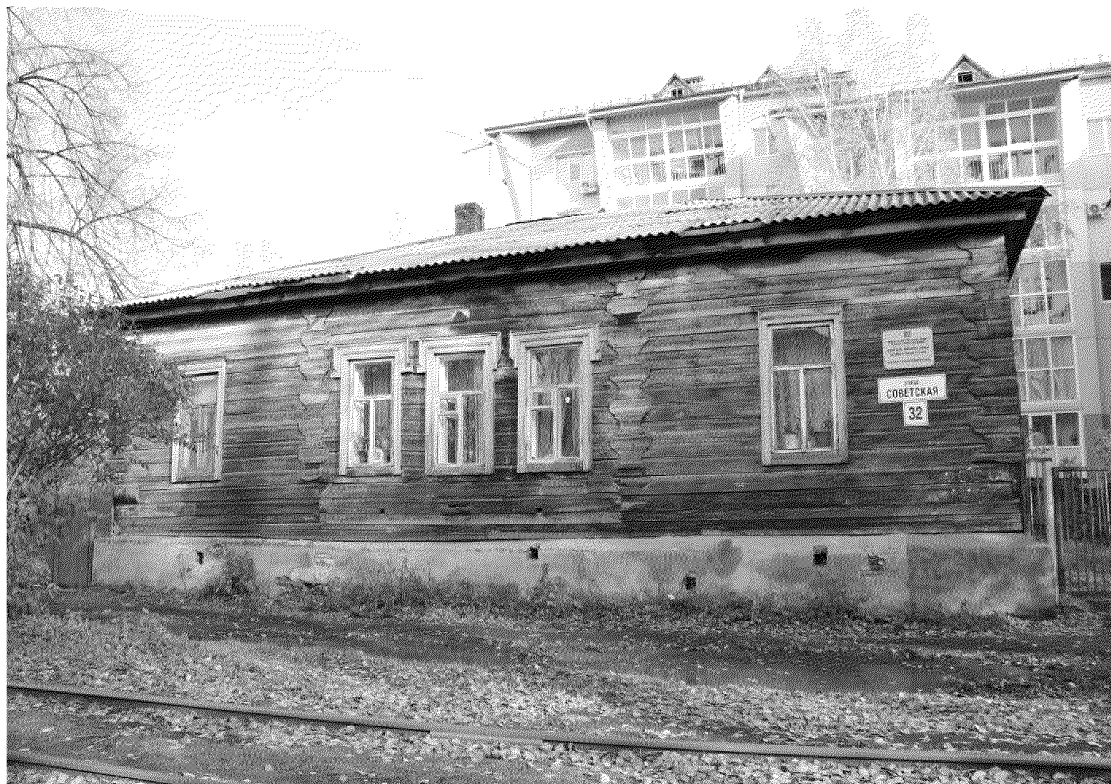
Видовая точка № 2. Главный (западный) фасад здания