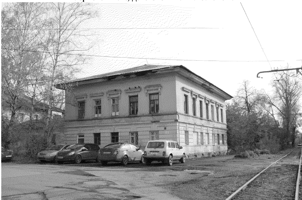
Видовая точка № 1. Жилой дом по ул. Советской, 30

Автор снимков: архитектор 2 категории ОГАУК «Центр по охране памятников» Верховая К.Е., дата съемки: 14.10.2020 г.