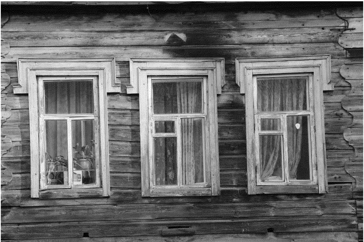
Видовая точка № 6. Фрагмент главного фасада