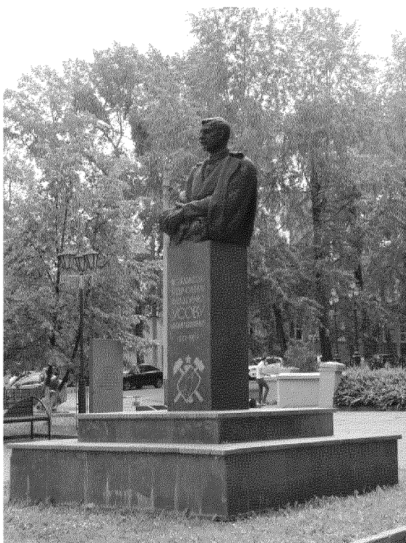
Видовая точка № 2. Общий вид памятника со стороны сквера