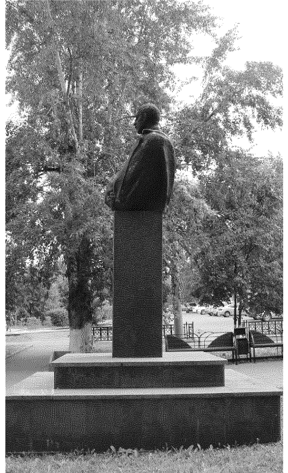
Видовая точка № 6. Общий вид памятника