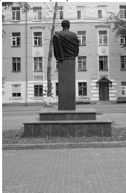
Видовая точка № 3. Общий вид памятника от учебного корпуса