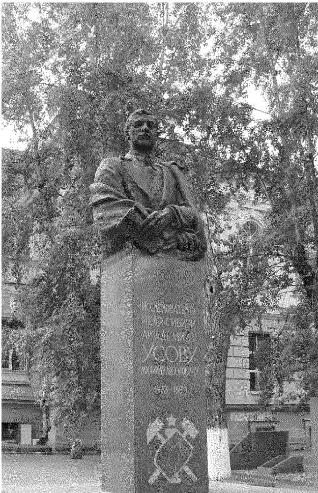
Видовая точка № 5. Общий вид памятника