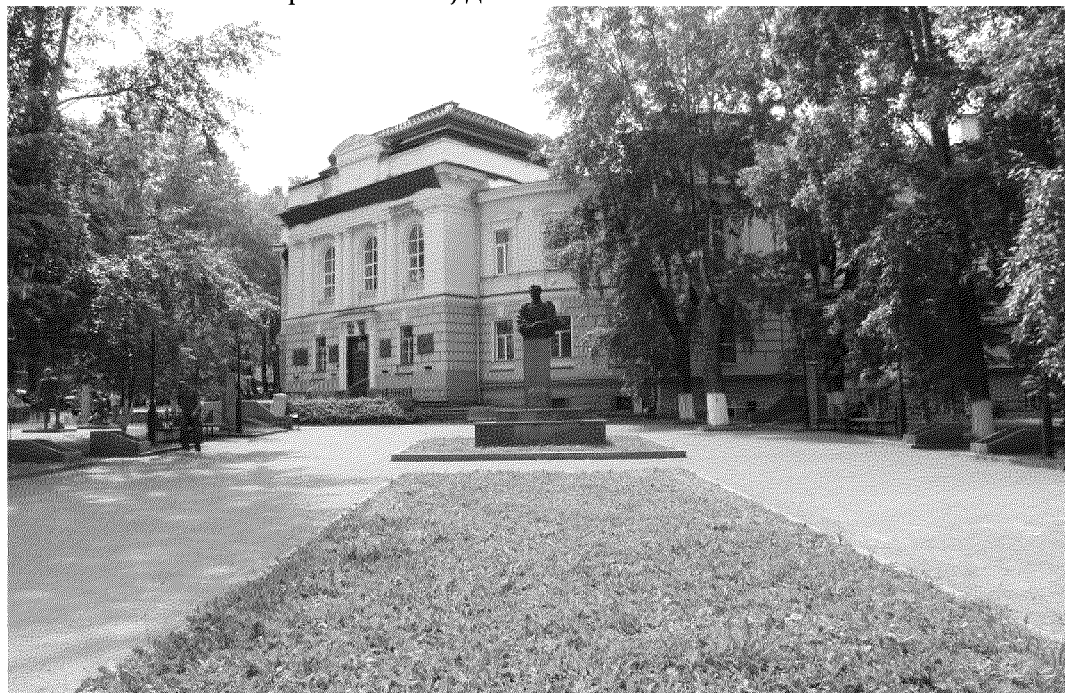
Видовая точка № 1.Общий вид памятника с пр. Кирова

Фотографические изображения объекта культурного наследия дата съемки: 25.06.2020 г.