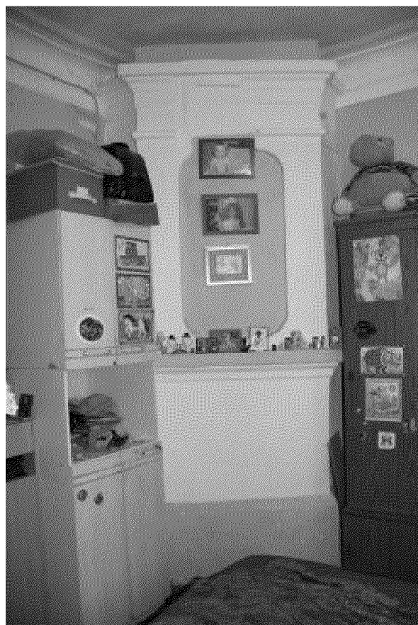
Видовая точка № 14