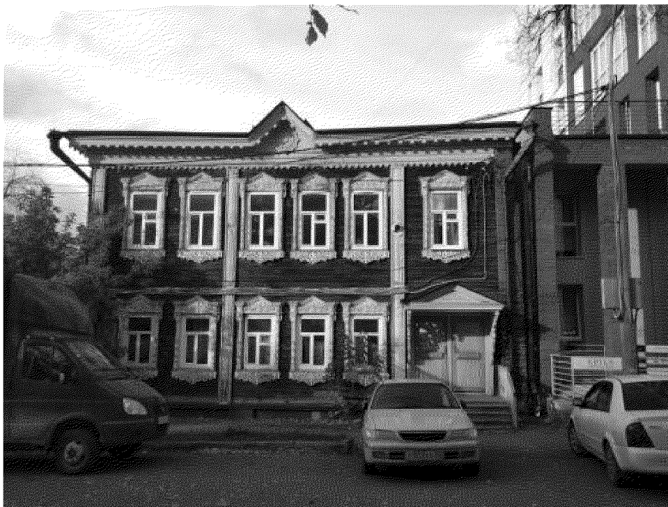
Видовая точка № 1