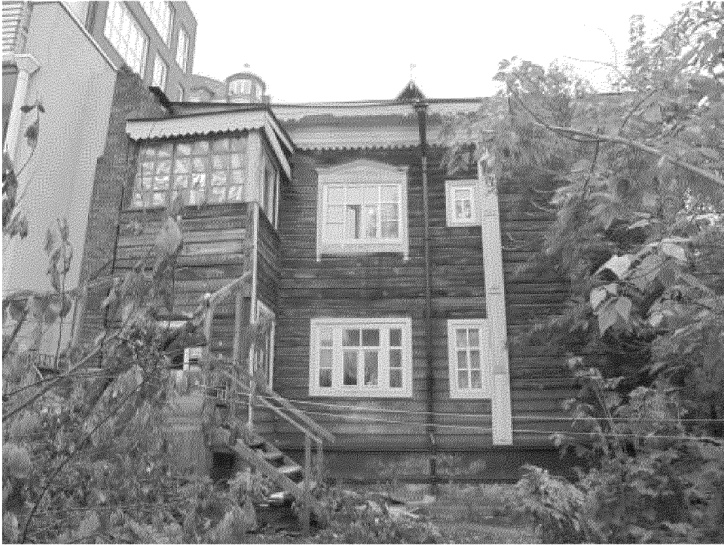
Видовая точка № 3