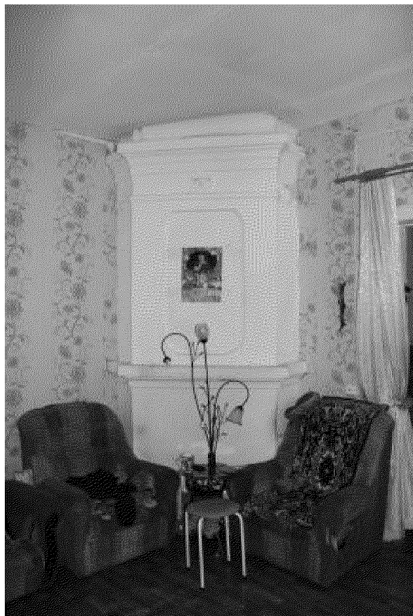
Видовая точка № 13