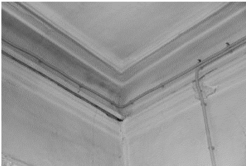
Видовая точка № 20