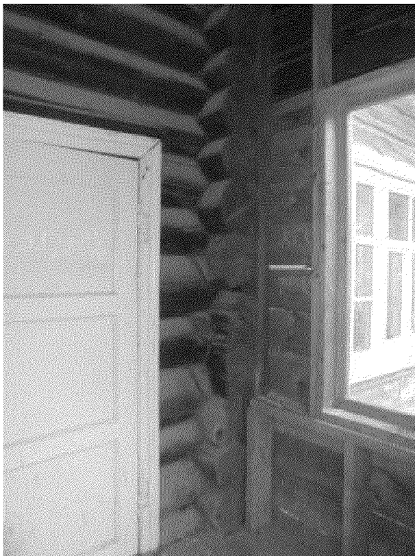
Видовая точка № 10