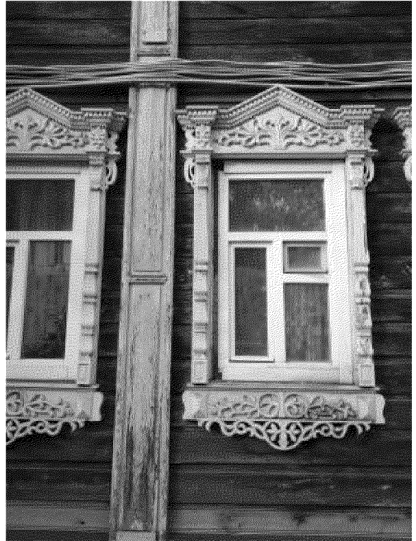
Видовая точка № 9