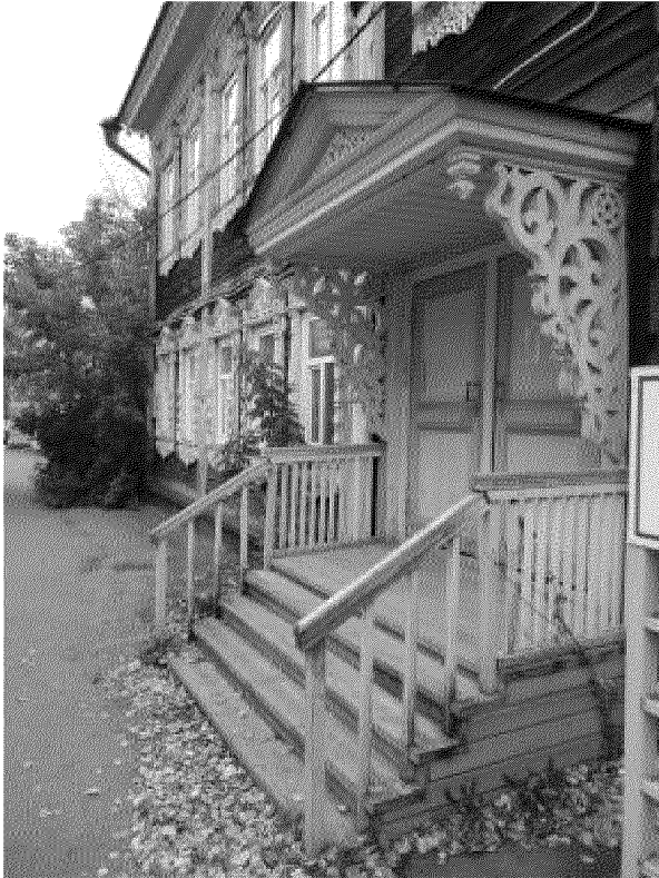
Видовая точка № 8