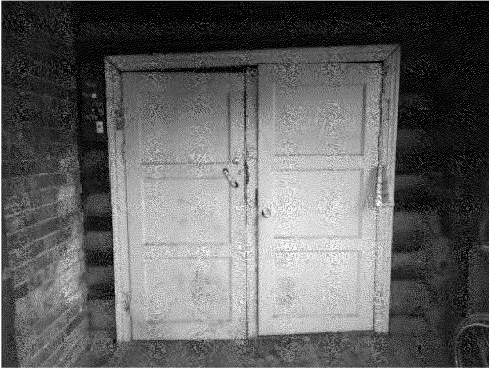
Видовая точка № 5