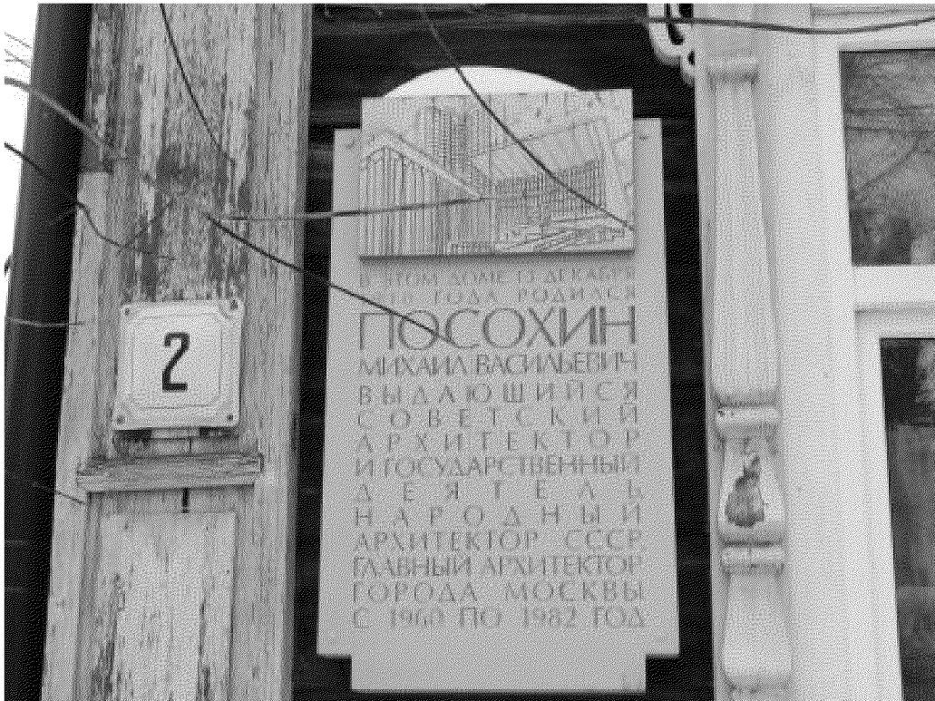
Видовая точка № 4