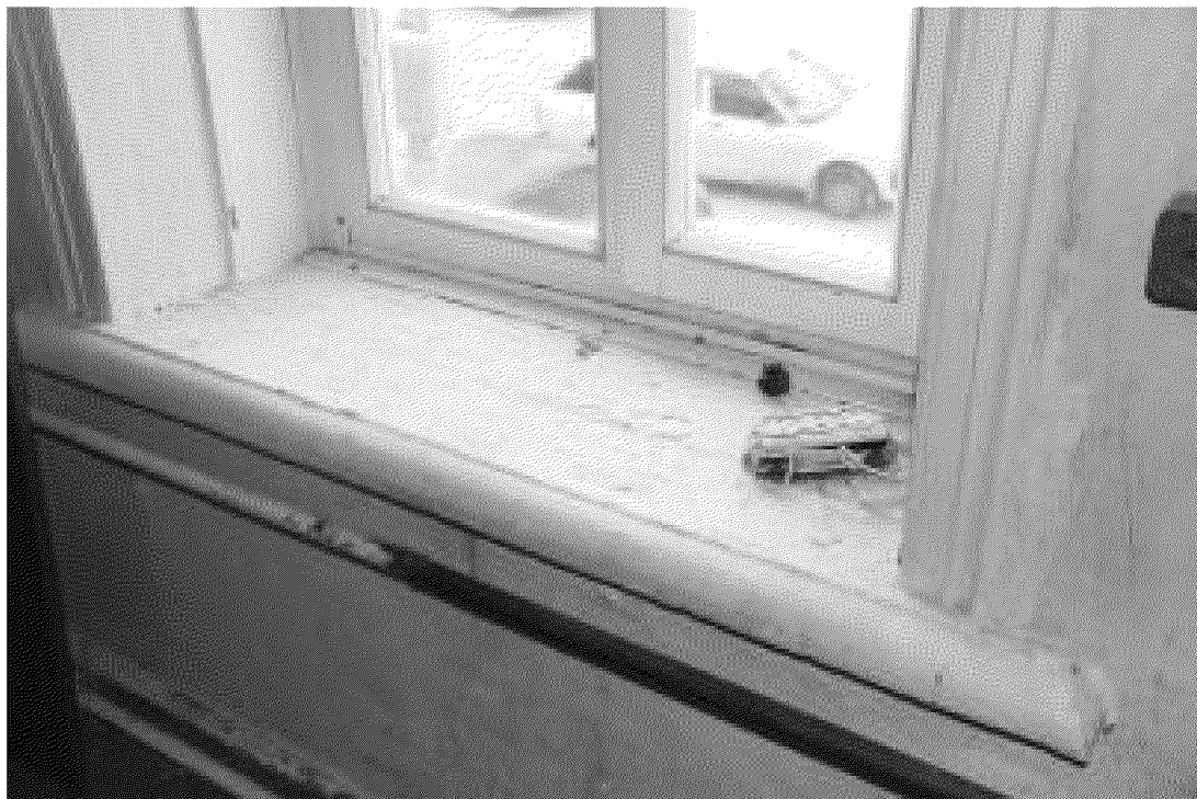
Видовая точка № 16