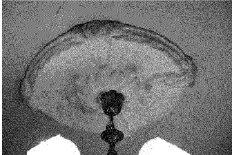
Видовая точка № 18