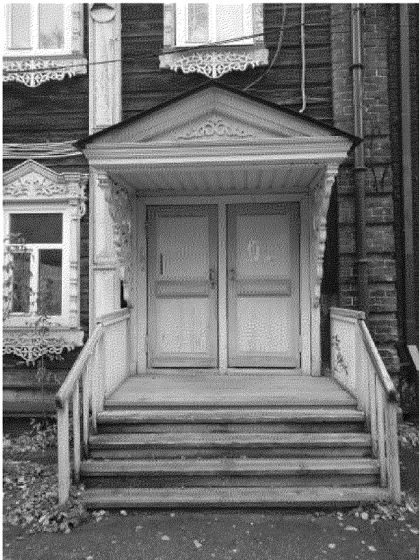
Видовая точка № 6