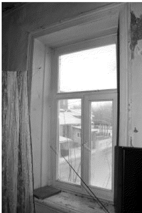
Видовая точка № 15