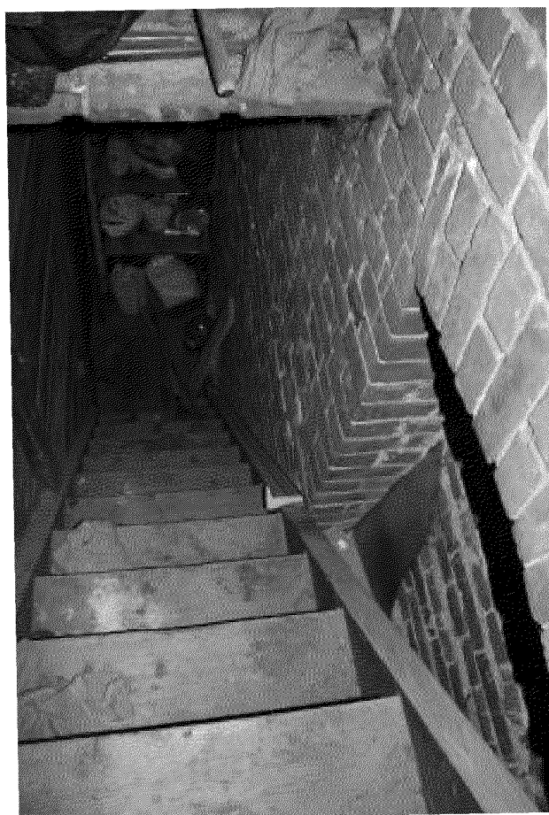
Видовая точка № 17