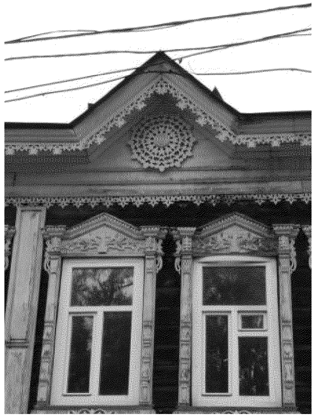
Видовая точка № 7