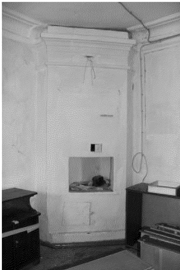
Видовая точка № 12