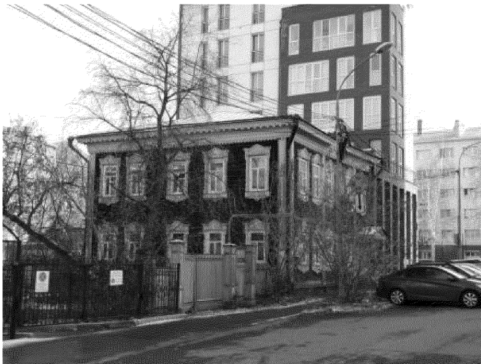
Видовая точка № 2