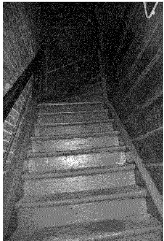
Видовая точка № 11