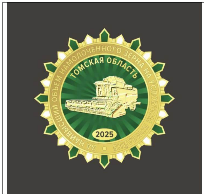
Рисунок знака «За наивысший объем намолоченного зерна на условном комбайне» им. Сливкина А.С.»

УТВЕРЖДЕН постановлением Губернатора Томской области от 23.09.2016 № 90