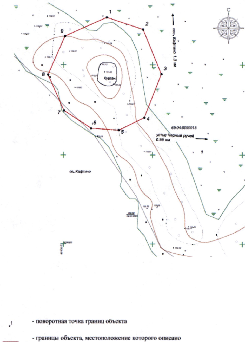
Схема границ территории объекта культурного наследия федерального значения «Курган Кафтино I», кон. I тыс. н.э., расположенного по адресу: Тверская область, Бологовский муниципальный округ, восточный берег оз. Кафтино, 1,5 км к югу от п. Кафтино, 0,4 км к северо-западу от зоны отдыха пос. урочище «Первые Дупли»