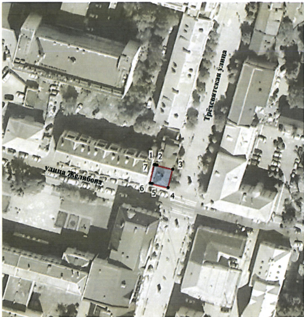
Схема границ территории объекта культурного наследия регионального значения «Дом жилой», 2-ая пол. XVIII в., расположенного по адресу: Тверская область, город Тверь, улица Желябова, дом 29/25