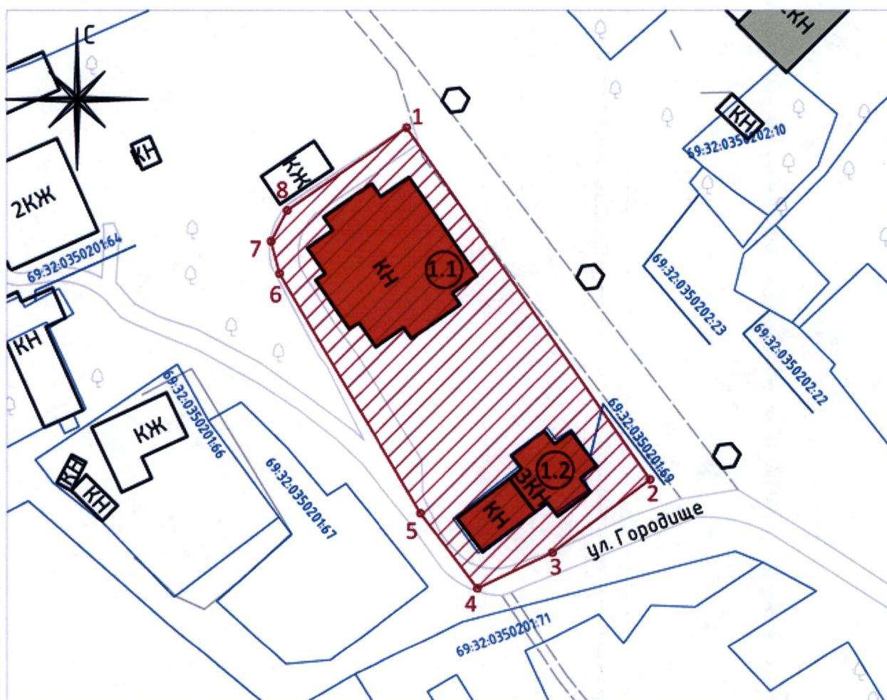
Схема границ территории объекта культурного наследия федерального значения (ансамбля) «Комплекс памятников», XIX в., включающего: «Борисоглебский собор», 1805 г., «Колокольня», 1817 г., расположенного по адресу: Тверская область, Старицкий муниципальный округ, город Старица, Городище