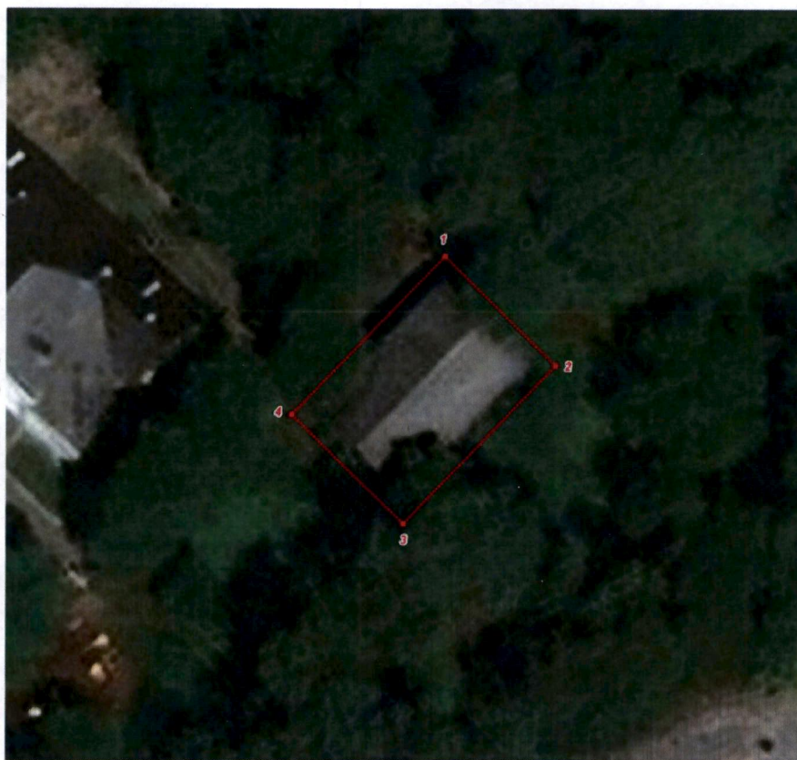
Схема границ территории объекта культурного наследия регионального значения «Флигель усадьбы Сахарово восточный жилой», 2-я пол. – кон. XIX в., расположенного по адресу: Тверская область, г. Тверь, п. Сахарово, ул. Маршала Василевского, д. 11