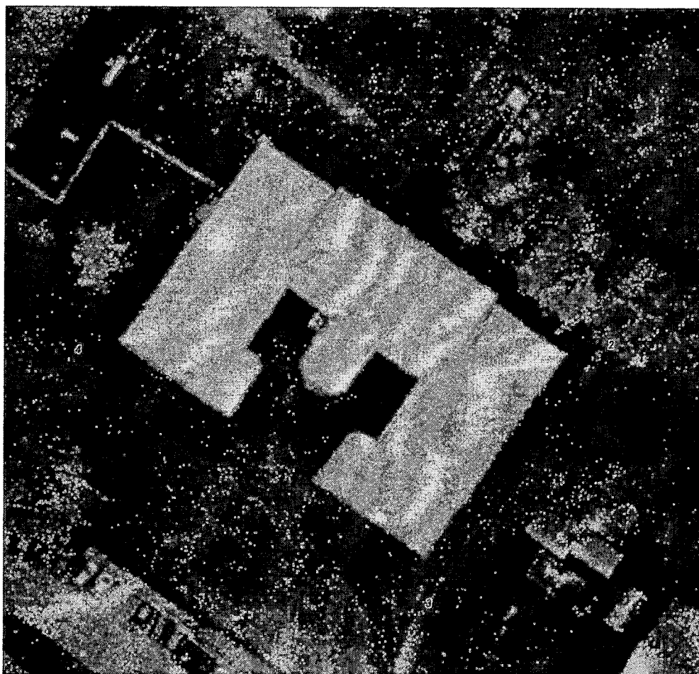
Схема границ территории объекта культурного наследия регионального значения «Здание школы при Станции», 1900 г., расположенного по адресу: Тверская область, г. Тверь, ул. Железнодорожников, д. 53