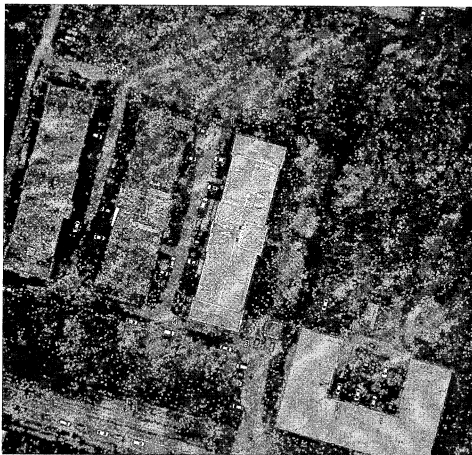
Схема границ территории объекта культурного наследия регионального значения «Здание рабочей казармы Берговской мануфактуры», 1900-е гг., расположенного по адресу: Тверская область, г. Тверь, ул. Спартака, д. 45, корпус 1