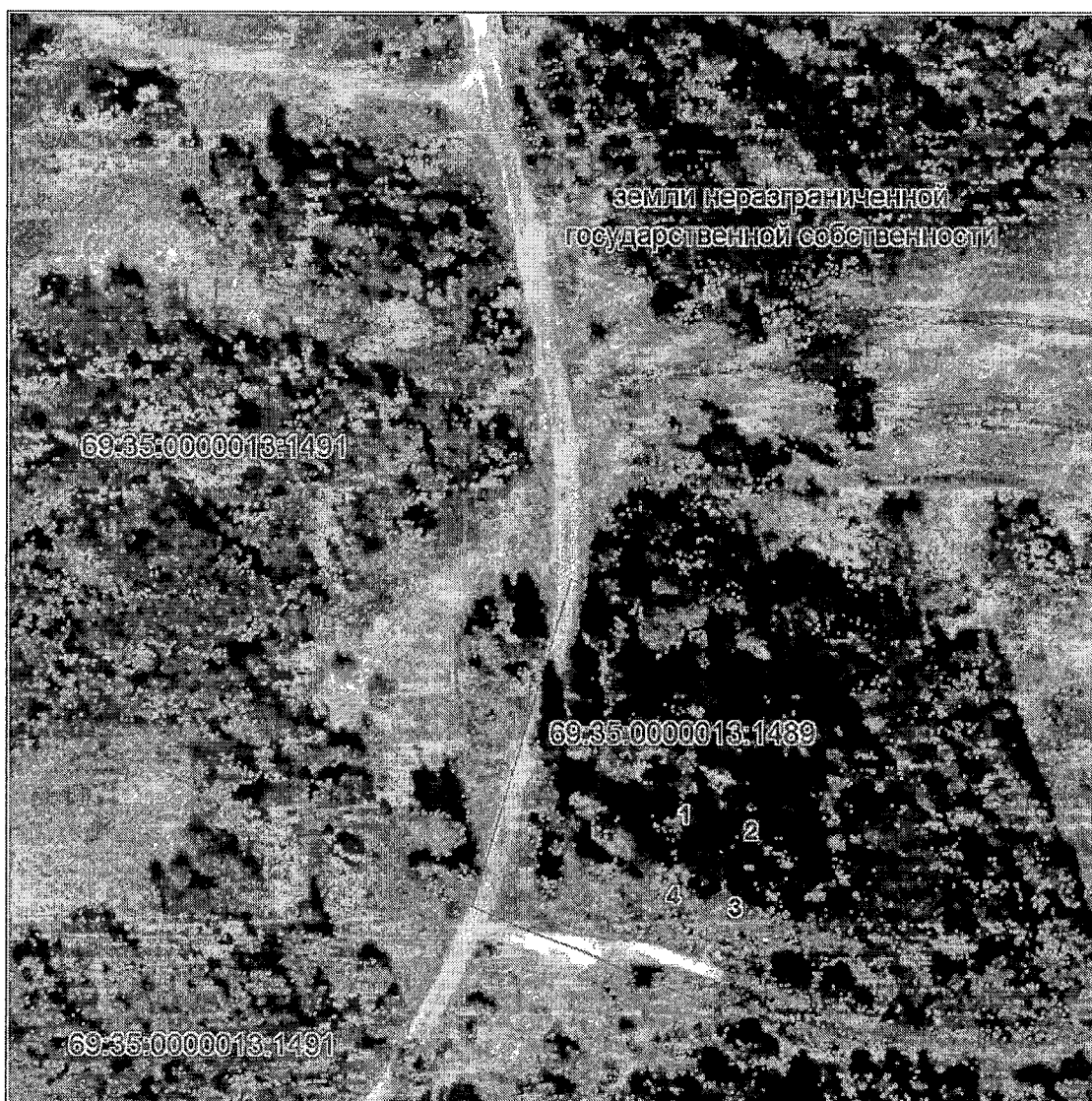
Схема границ территории объекта культурного наследия федерального значения «Могила Венецианова Алексея Гавриловича (1780 – 1847)», 1847 г., расположенного по адресу: Тверская область, Удомельский муниципальный округ, деревня Венецианово