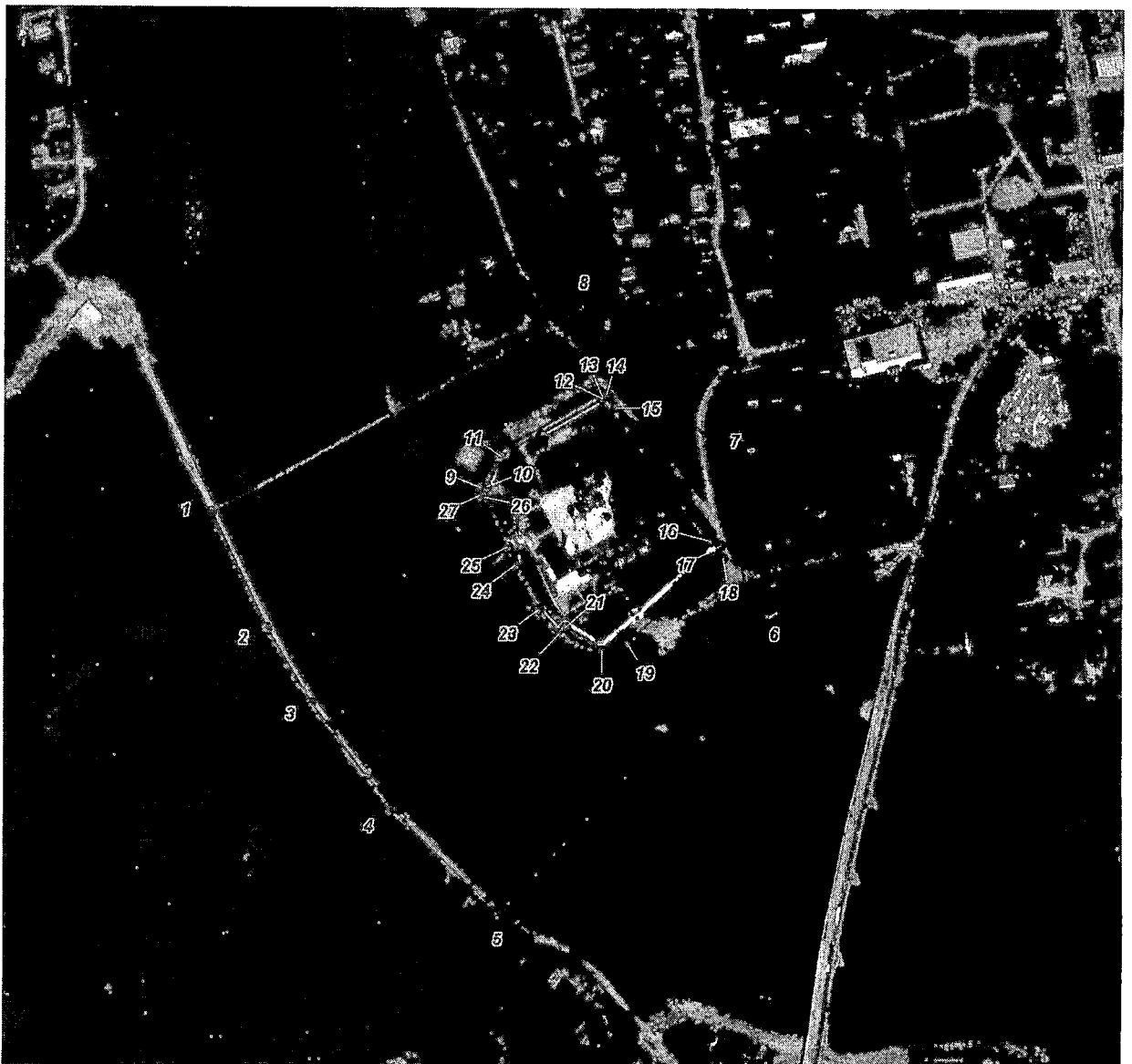
Схема границы защитной зоны объекта культурного наследия федерального значения «Успенский монастырь», XVI-XIX вв., расположенного по адресу: Тверская область, Старицкий муниципальный округ, город Старица