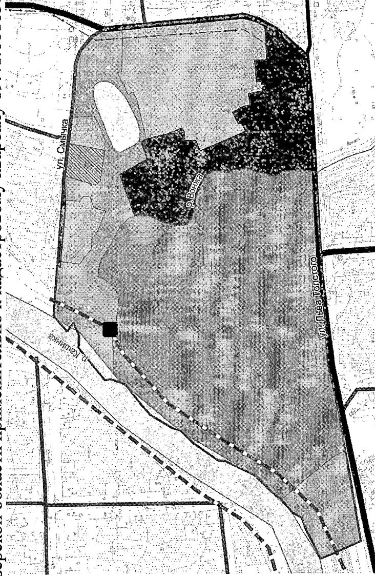
Рисунок 1. Карта планируемого размещения объектов.

Карта планируемого размещения объектов местного значения Кашинского муниципального округа Тверской области применительно к кадастровому кварталу 69:41:0010314