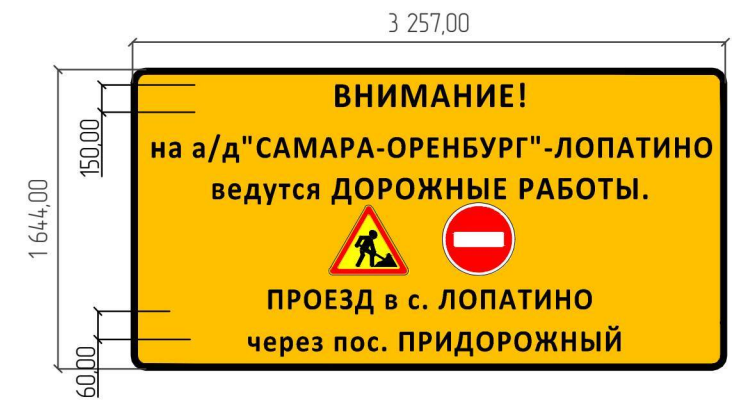
Информационный щит №1 и Щит №2