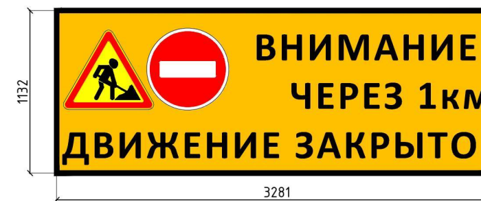
Информационный щит №4