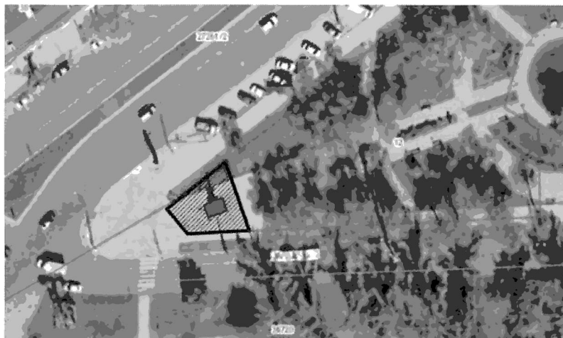
Границы территории объекта культурного наследия