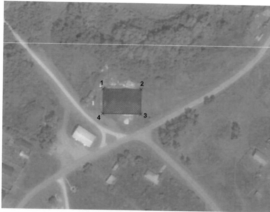
Схема границ территории объекта культурного наследия