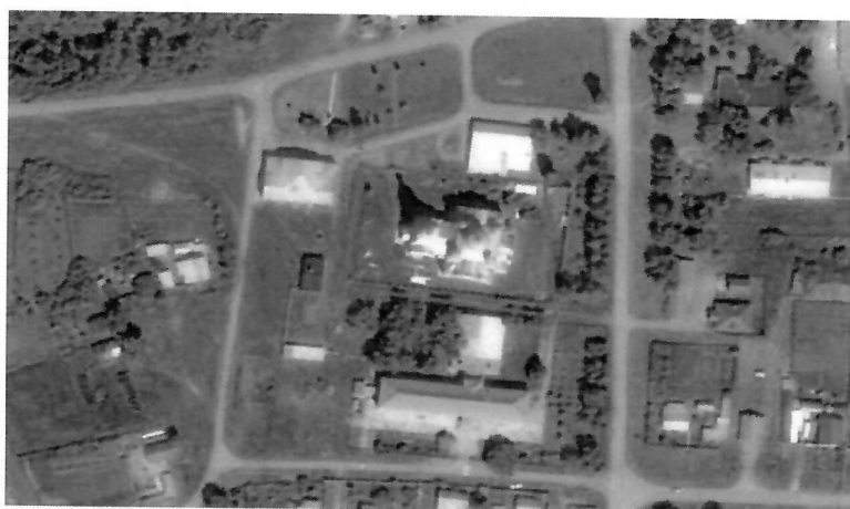
Схема границ территории объекта культурного наследия