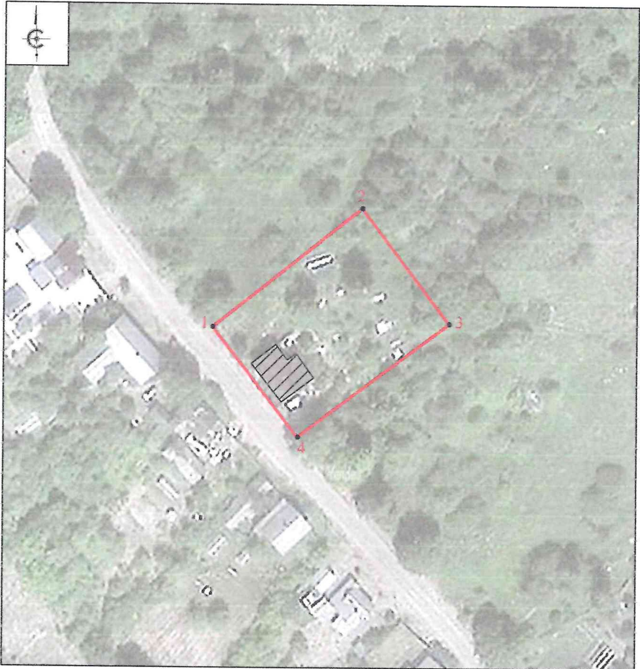
Схема границ территории объекта культурного наследия регионального значения «Усадьба крестьянская. Дом жилой со службами», начало XX в., расположенного по адресу: Псковская область, Гдовский муниципальный округ, д. Бешкино-2, д. 9