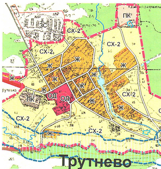
Утвержденные правила землепользования и застройки