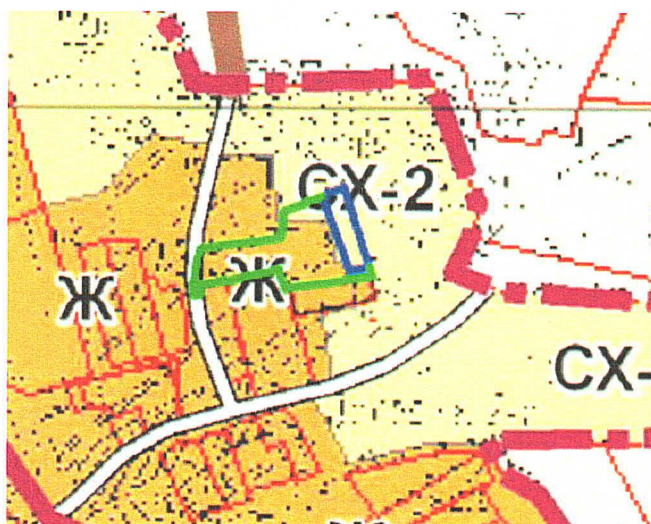
Утвержденные правила землепользования и застройки