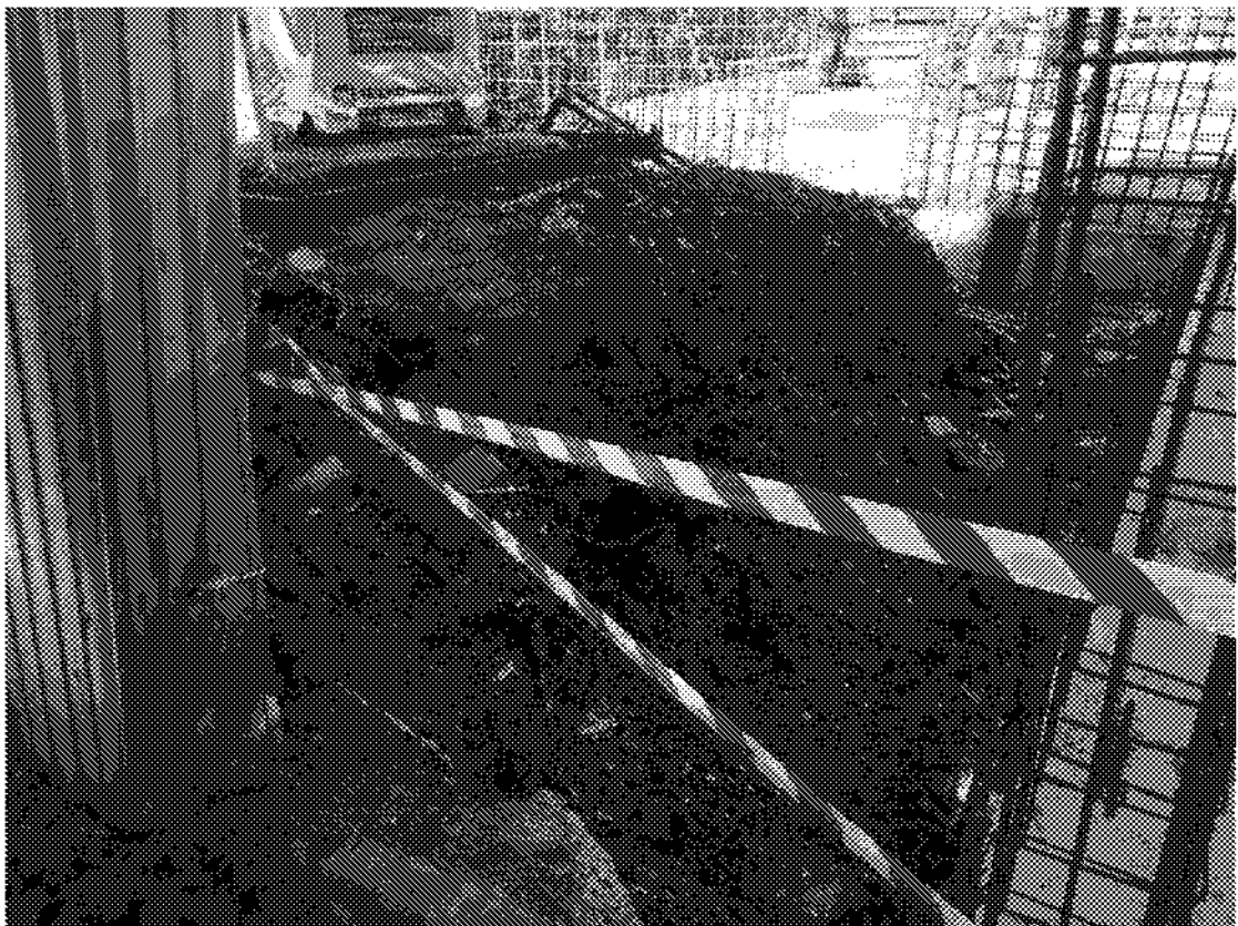
Фото 3. Земельный участок с кадастровым номером 58:29:3003012:13, в границах объекта культурного наследия федерального значения "Культурный слой г. Пензы", вид с востока (03.06.2026)