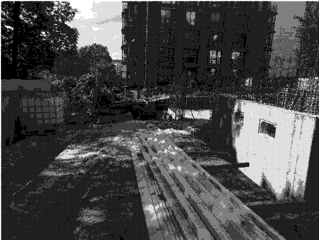
Фото 1. Земельный участок с кадастровым номером 58:29:3003012:13, в границах объекта культурного наследия федерального значения "Культурный слой г. Пензы", вид с севера (03.06.2026)