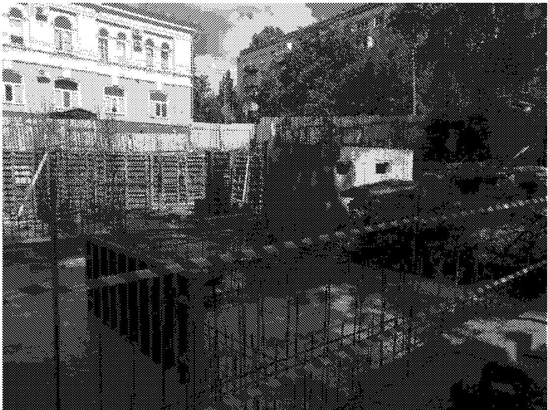
Фото 4. Земельный участок с кадастровым номером 58:29:3003012:13, в границах объекта культурного наследия федерального значения "Культурный слой г. Пензы", вид с юго-востока (03.06.2026)