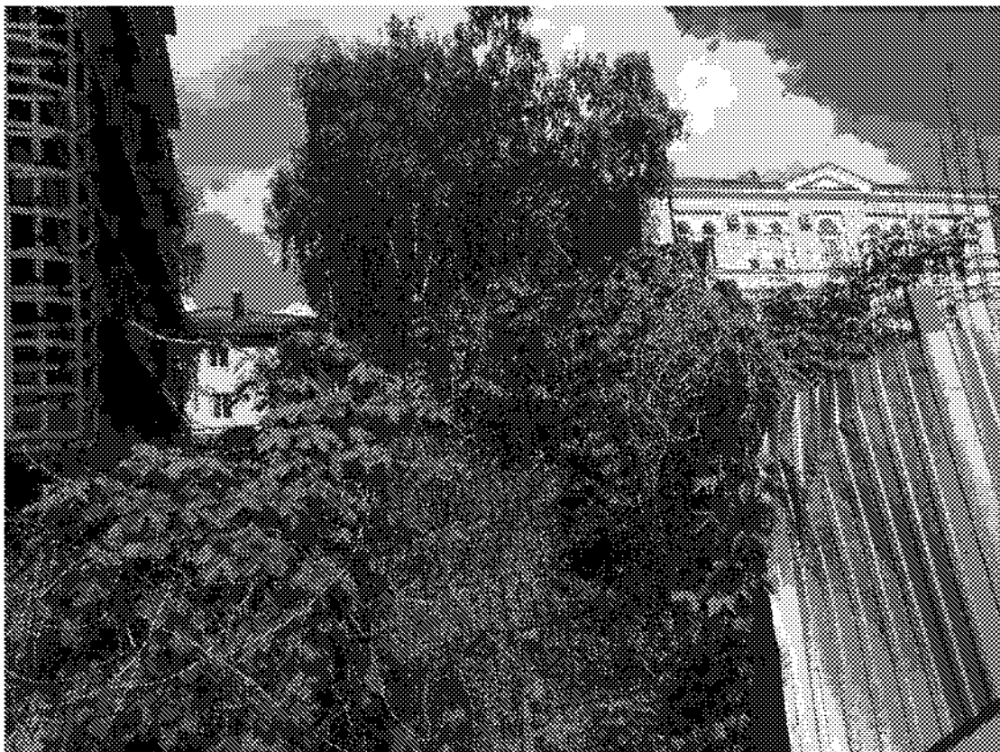
Фото 5. Земельный участок с кадастровым номером 58:29:3003012:13, в границах объекта культурного наследия федерального значения "Культурный слой г. Пензы", вид с востока (03.06.2026)