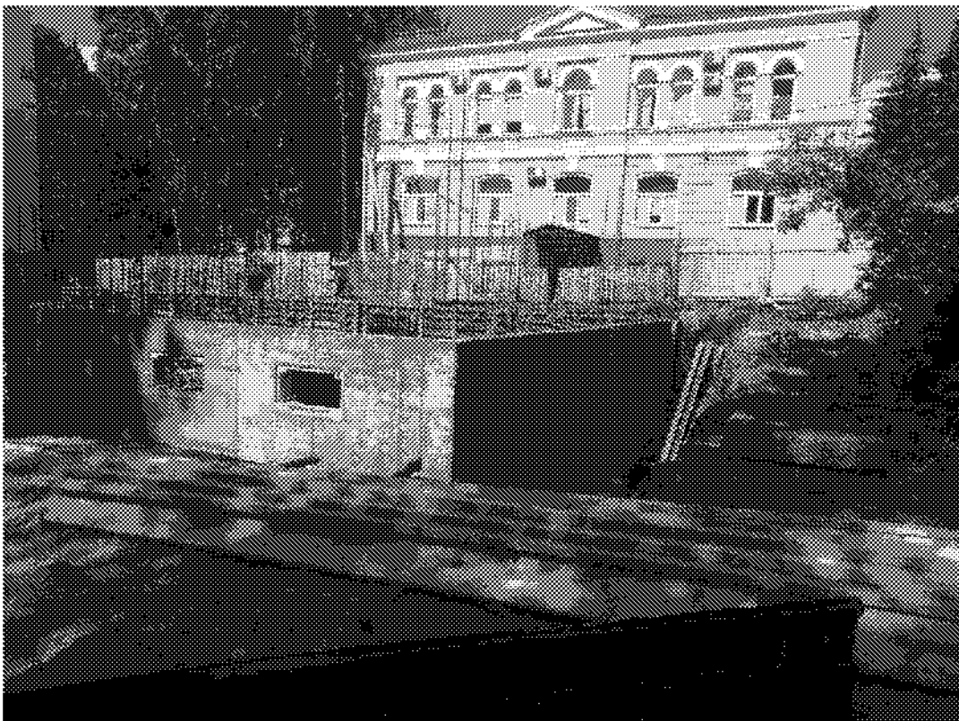
Фото 2. Земельный участок с кадастровым номером 58:29:3003012:13, в границах объекта культурного наследия федерального значения "Культурный слой г. Пензы", вид с востока (03.06.2026)