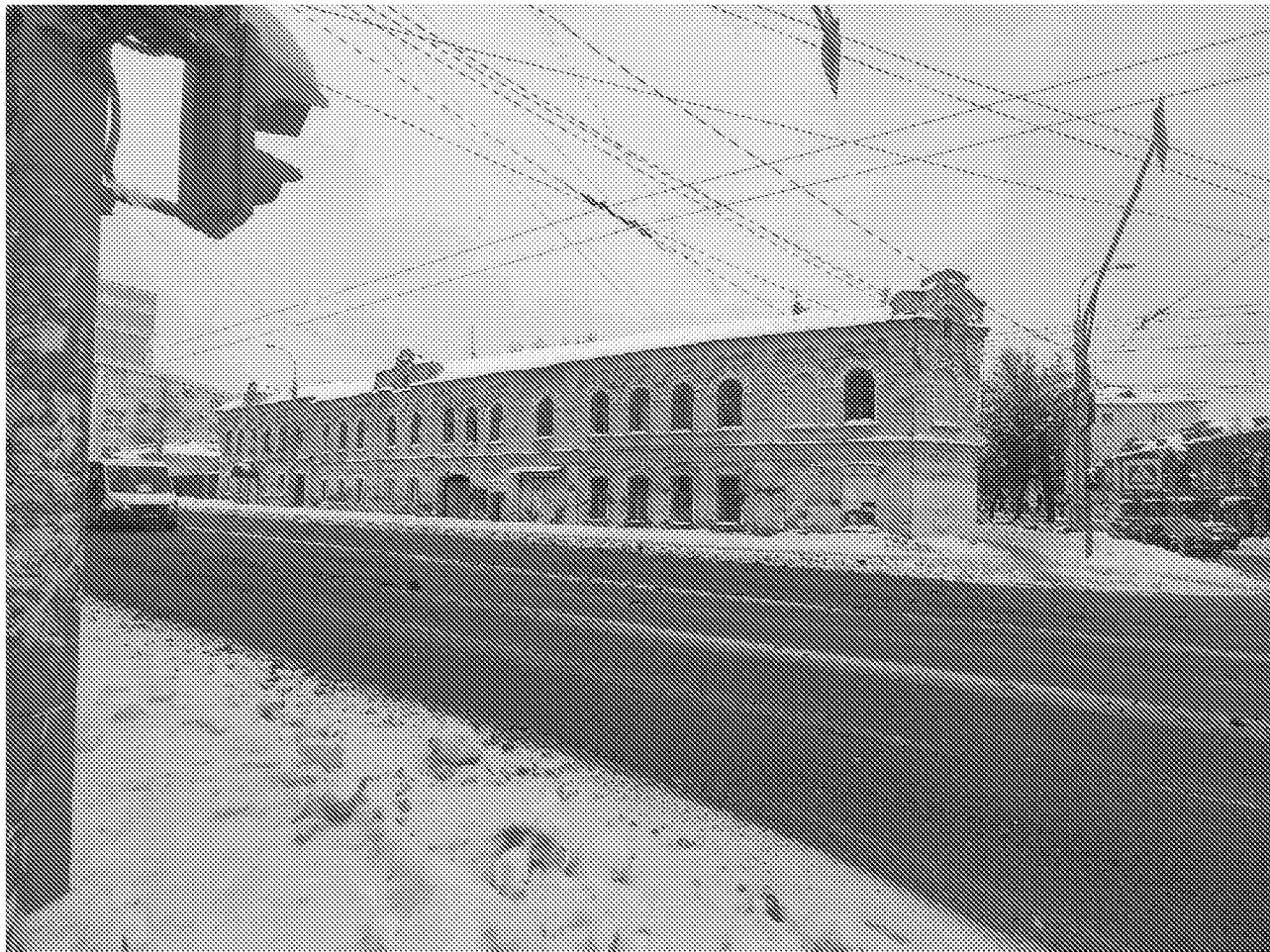
Вид на главный фасад объекта культурного наследия