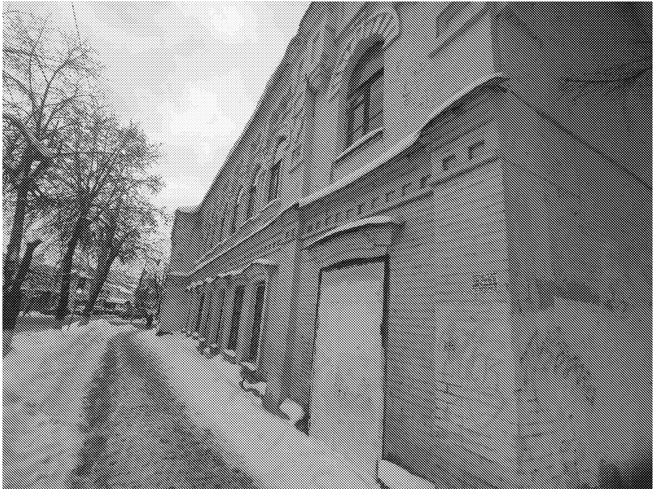
Фрагмент восточного фасада объекта культурного наследия