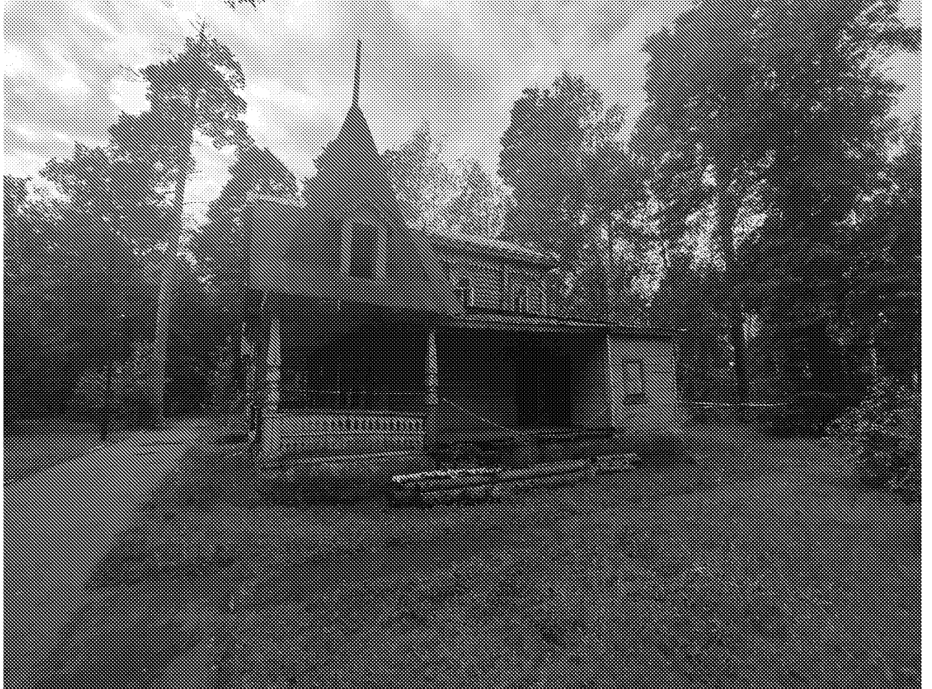
Фрагмент фасада объекта культурного наследия