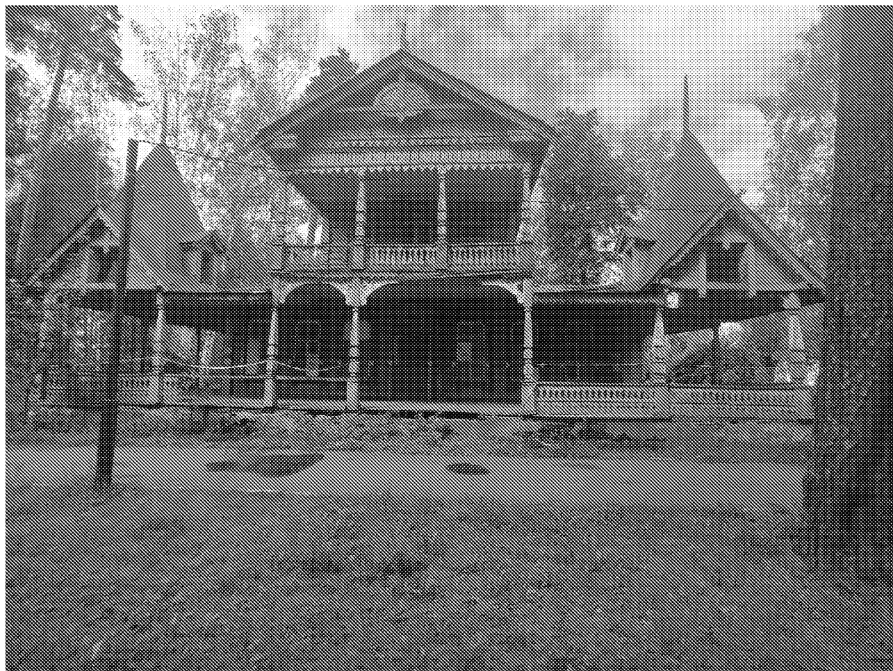
Вид на главный фасад объекта культурного наследия