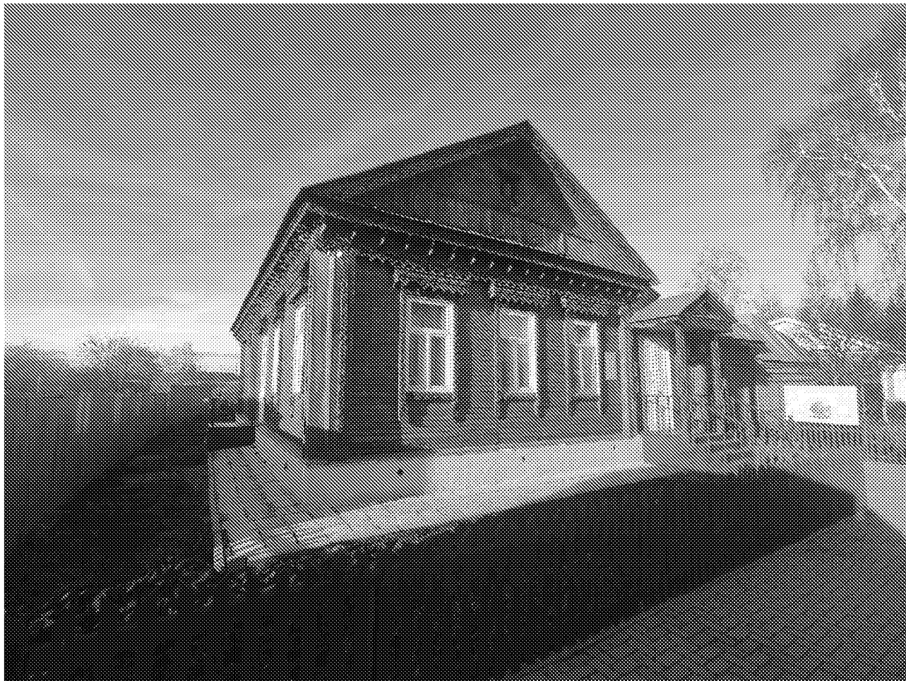
Вид на главный фасад объекта культурного наследия