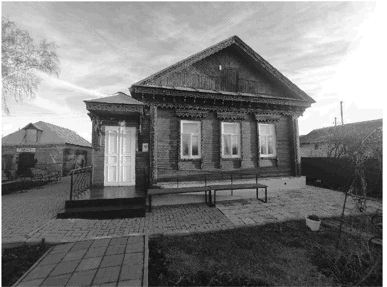
Фасад объекта культурного наследия