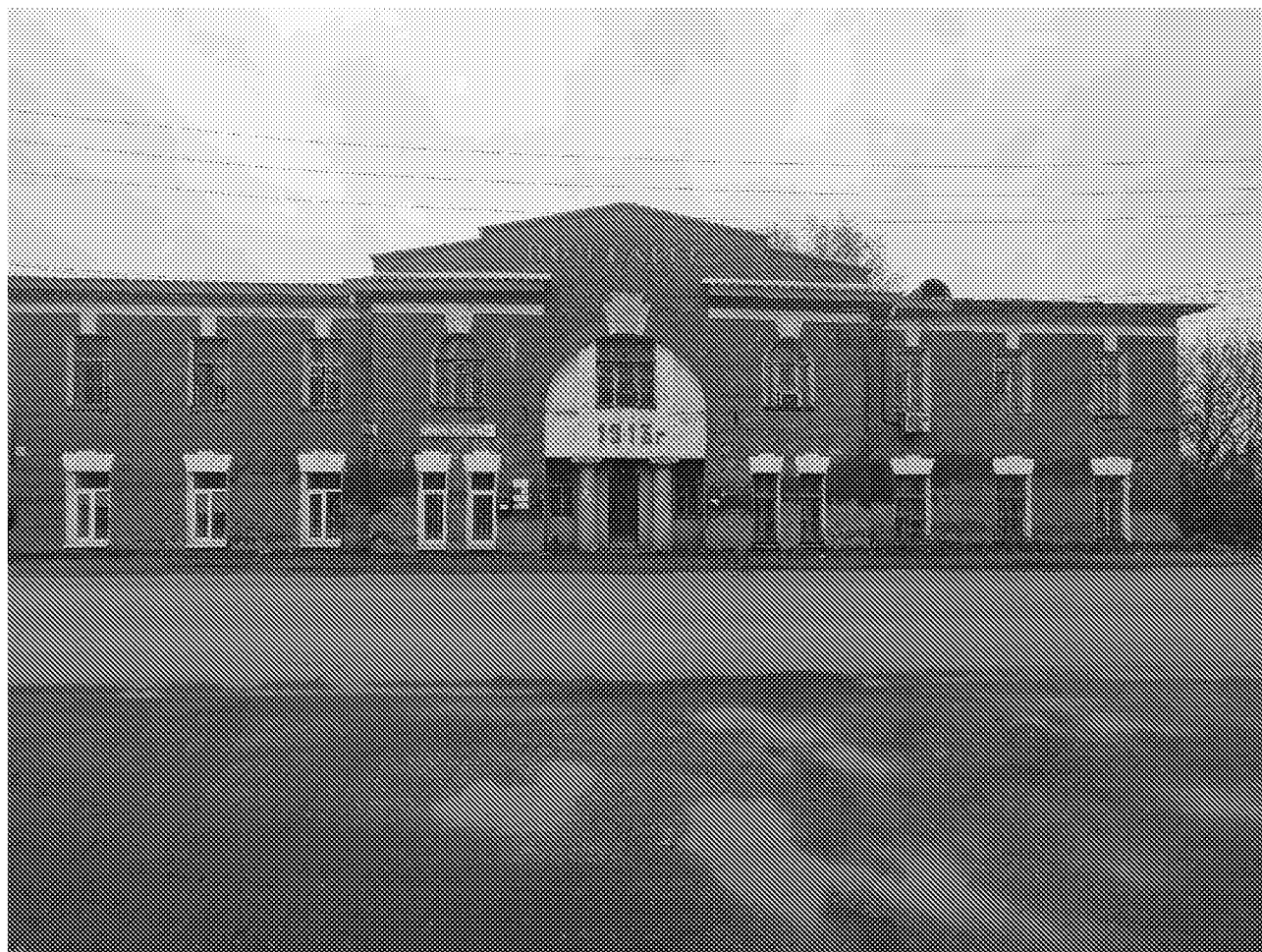
Вид на главный фасад объекта культурного наследия