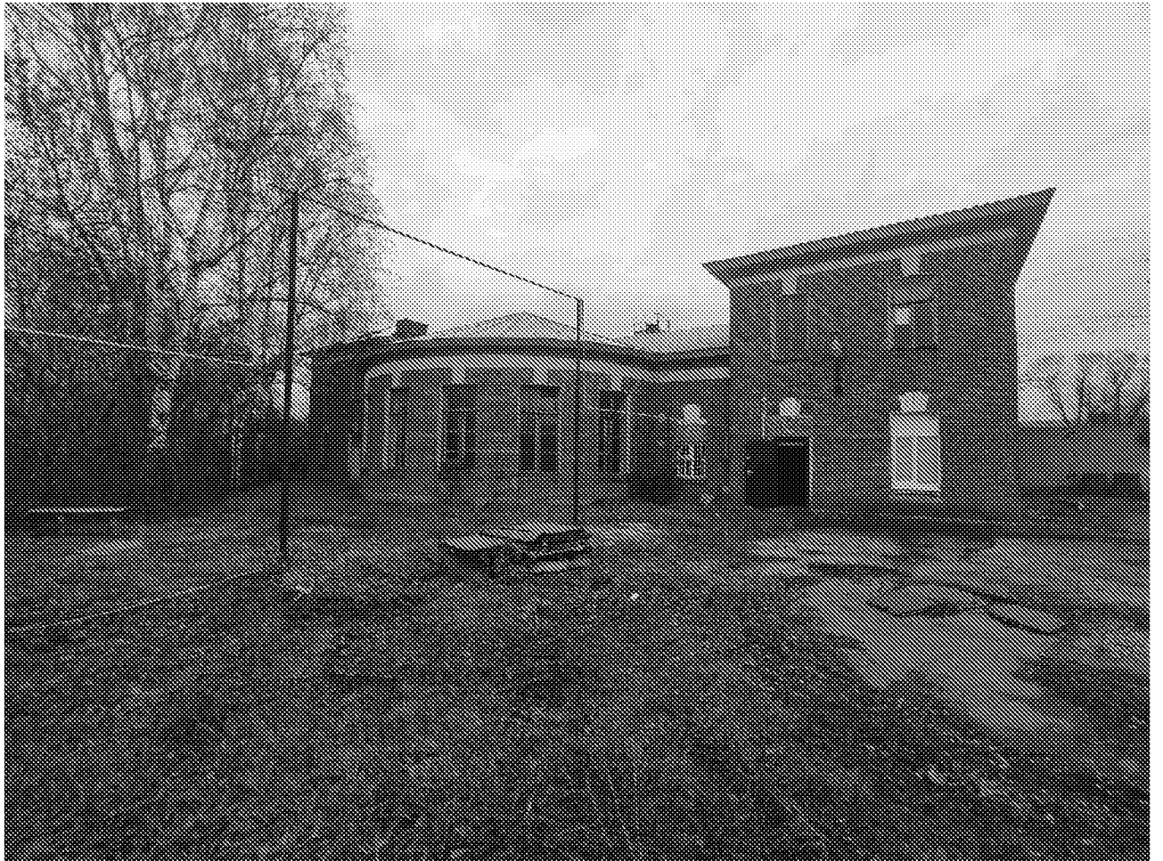
Вид на фасад объекта культурного наследия