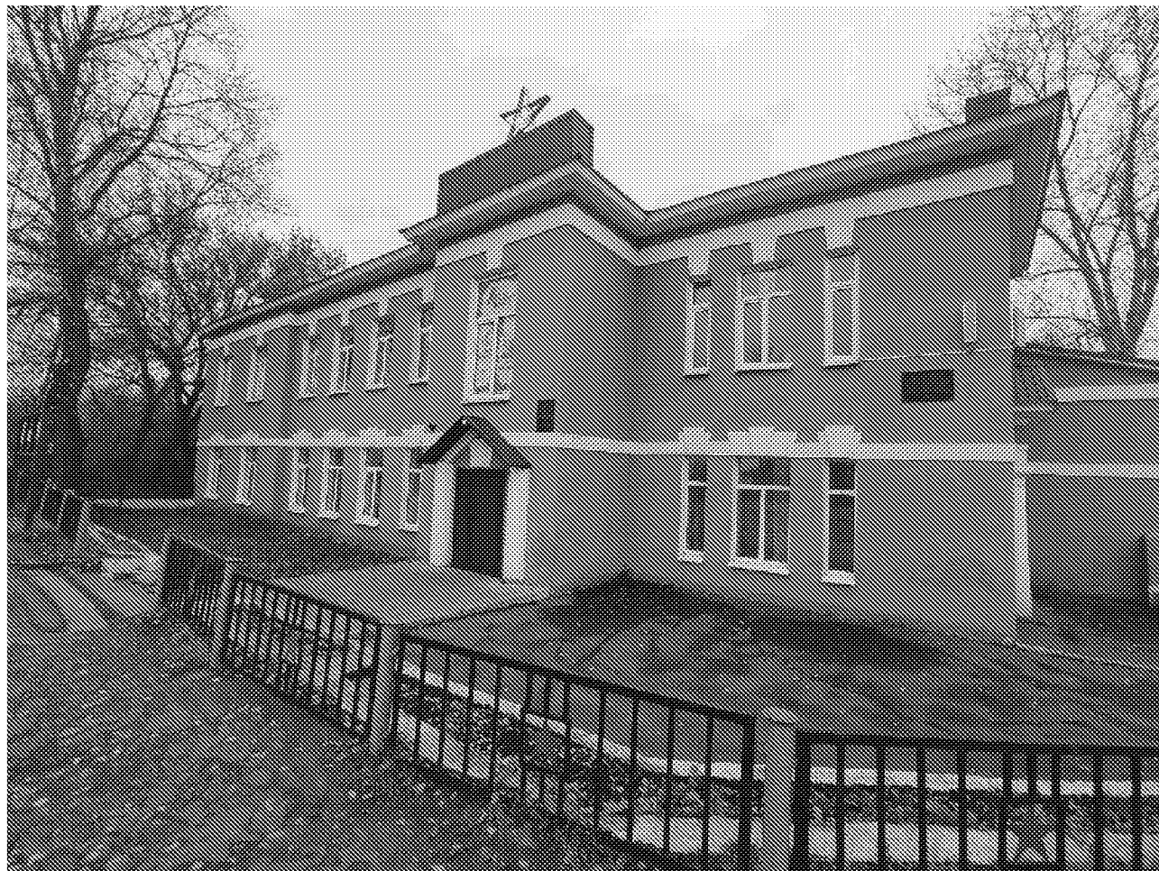
Вид на главный фасад объекта культурного наследия

Фотографическое изображение объекта культурного наследия «Здание бывшего крестьянского поземельного банка, где 17 февраля 1918 года провозглашено установление в Каменской волости Советской власти» (Пензенская область, Каменский район, г. Каменка, ул. Советская, 97)