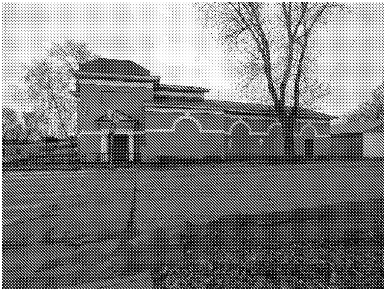
Вид на фасад объекта культурного наследия