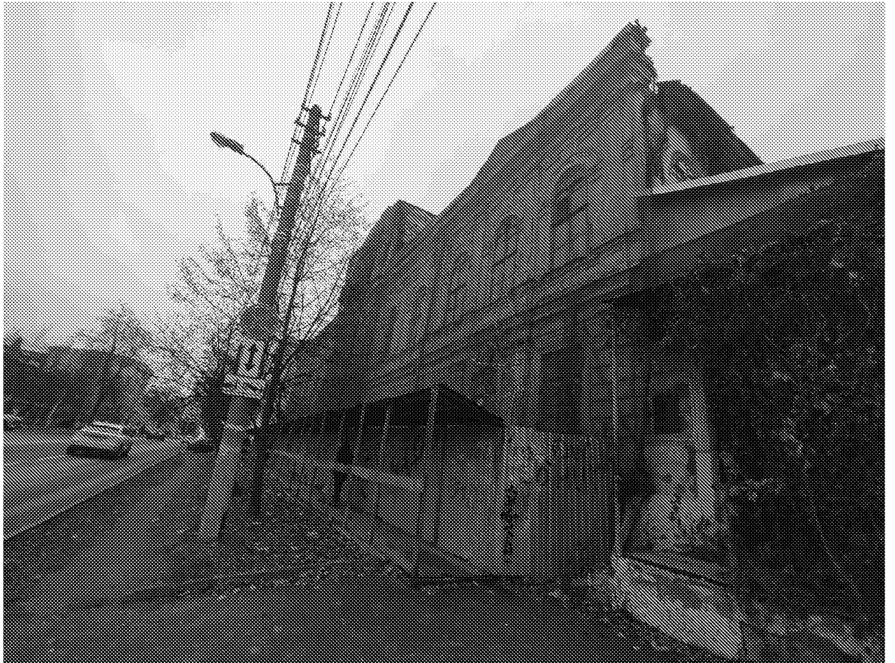
Вид на главный фасад объекта культурного наследия