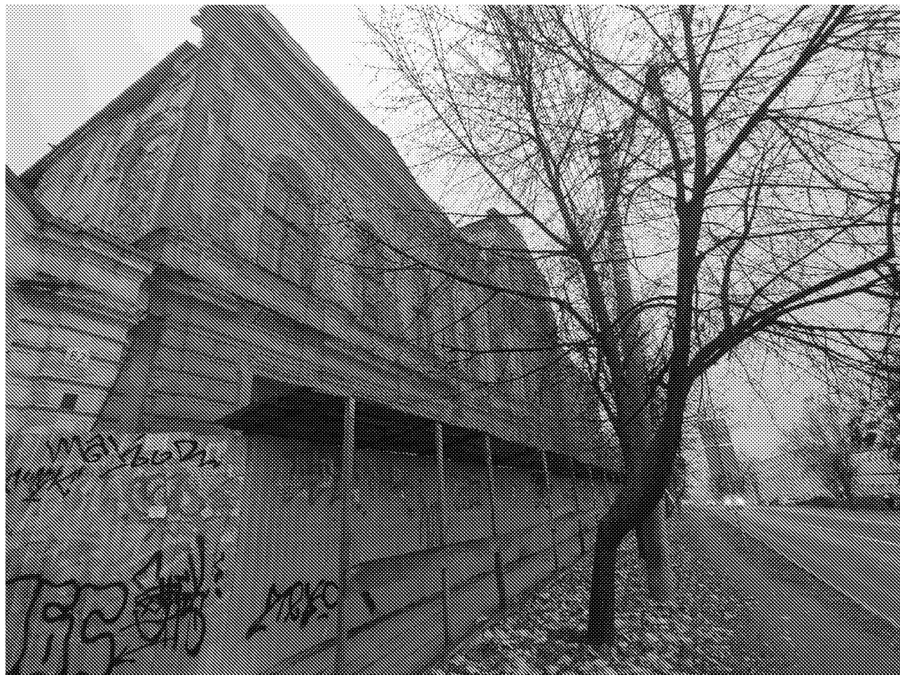
Вид на главный фасад объекта культурного наследия