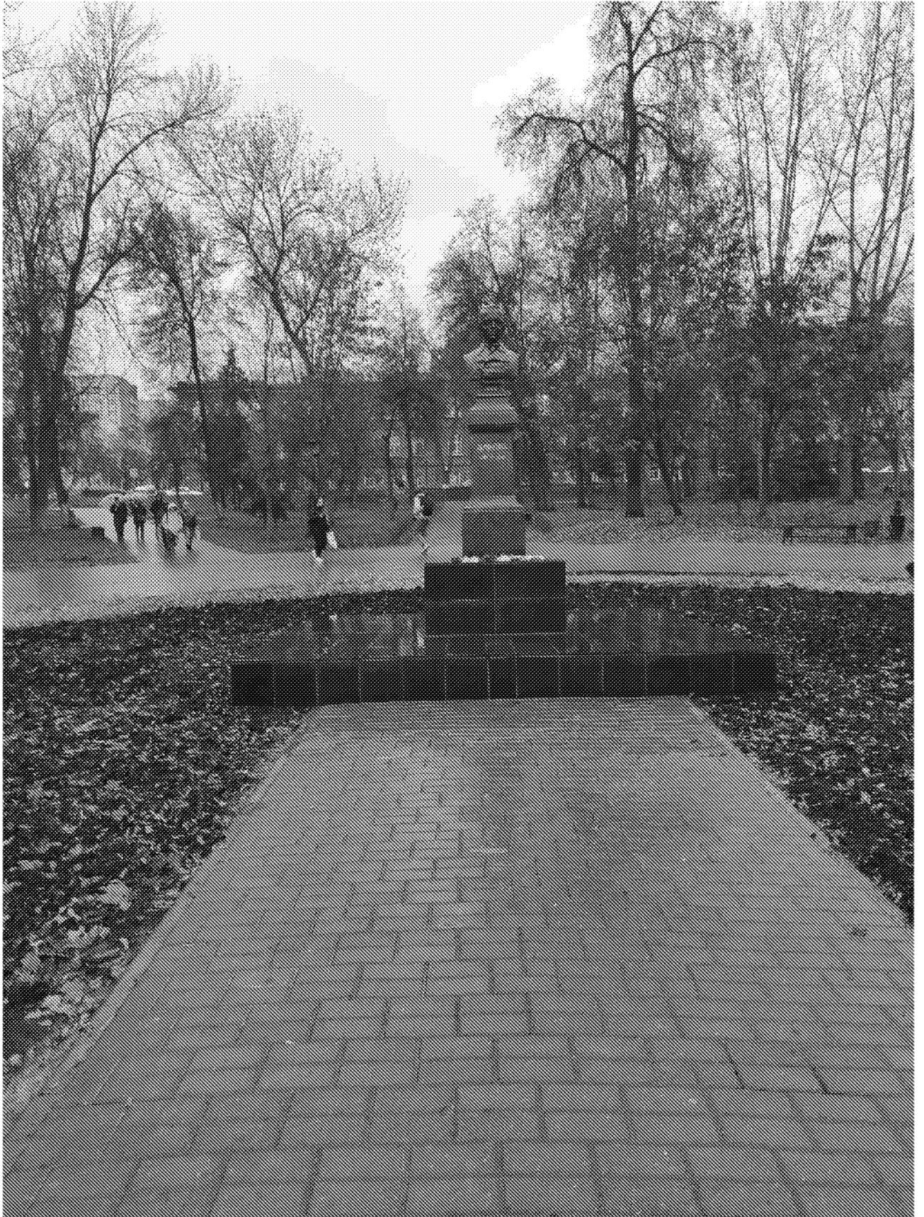
Вид на объект культурного наследия