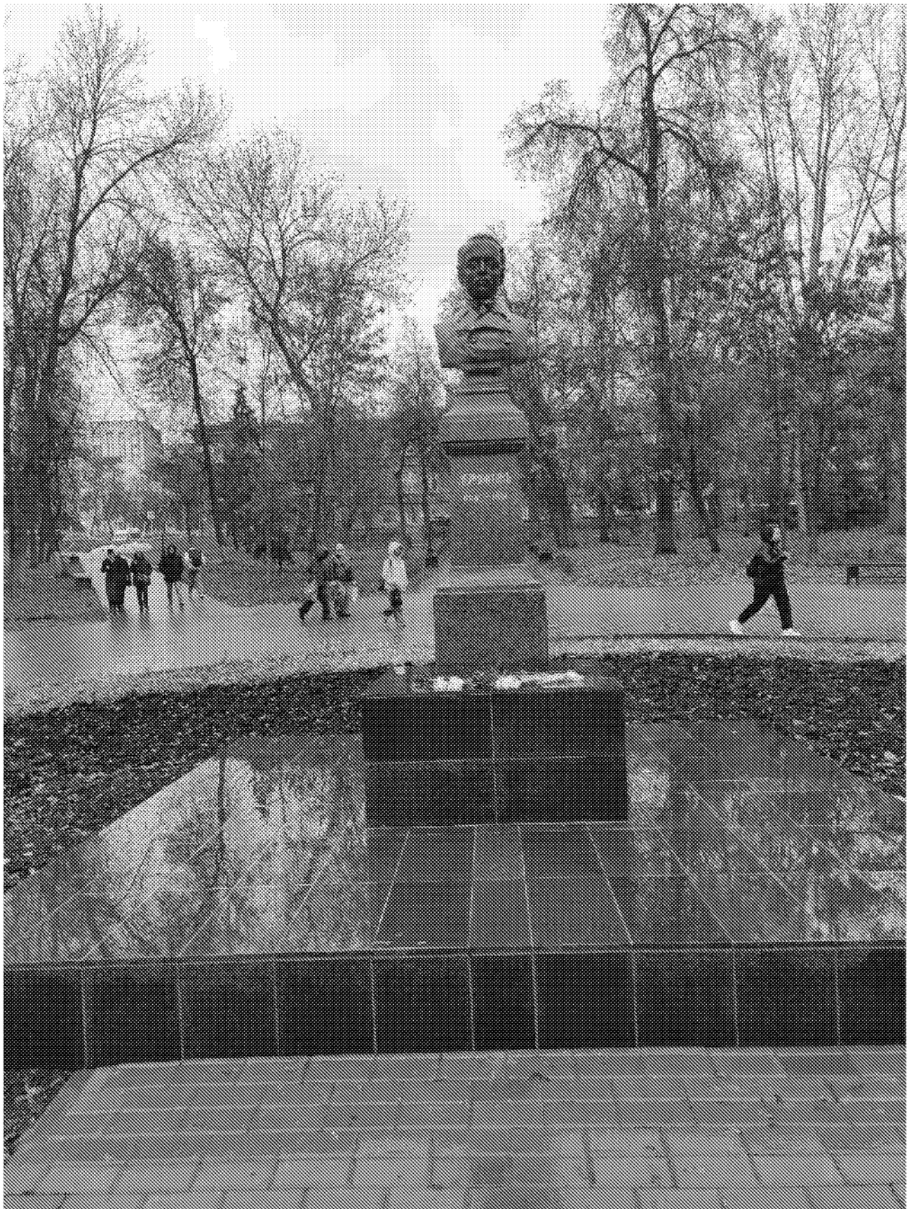
Вид на объект культурного наследия