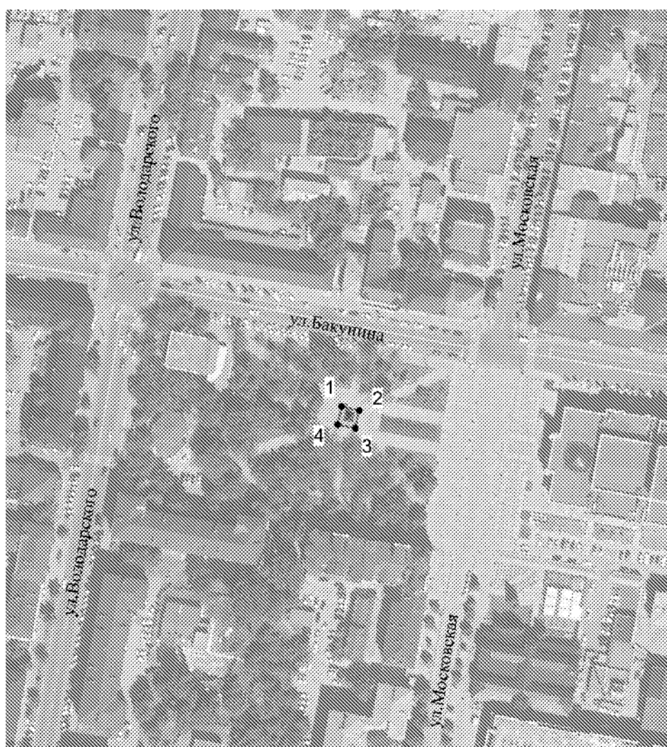
Схема границ территории объекта культурного наследия федерального значения «Памятник В.Г. Белинскому», 1954 г.

Границы территории объекта культурного наследия федерального значения «Памятник В.Г. Белинскому», расположенного по адресу: Пензенская область, г. Пенза, около городского театра