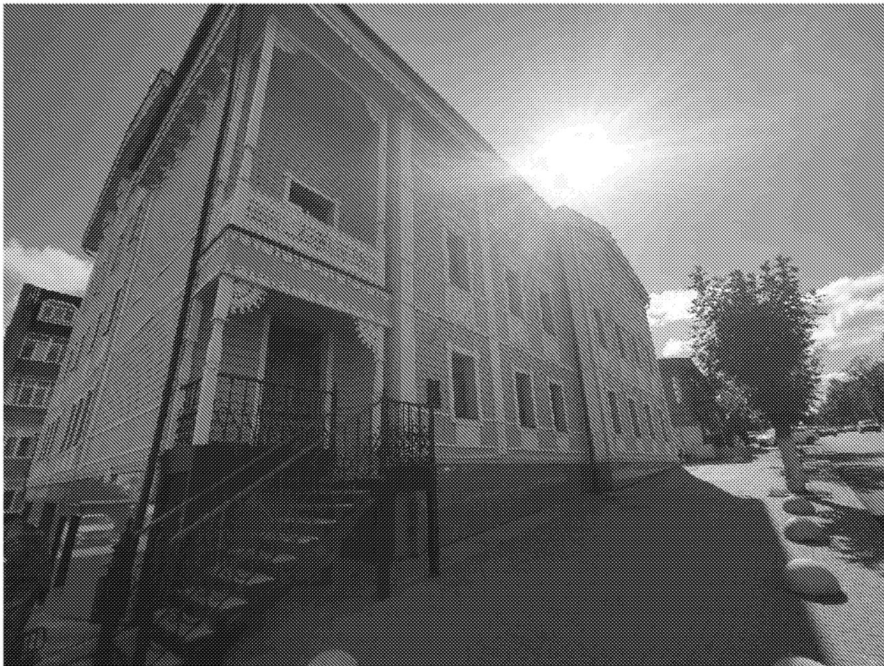
Вид на главный фасад объекта культурного наследия