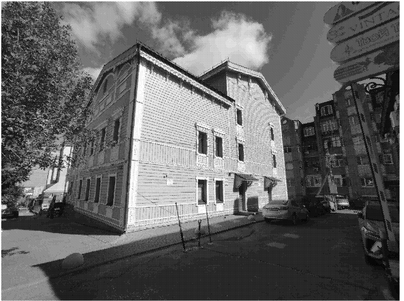
Фрагмент фасада объекта культурного наследия