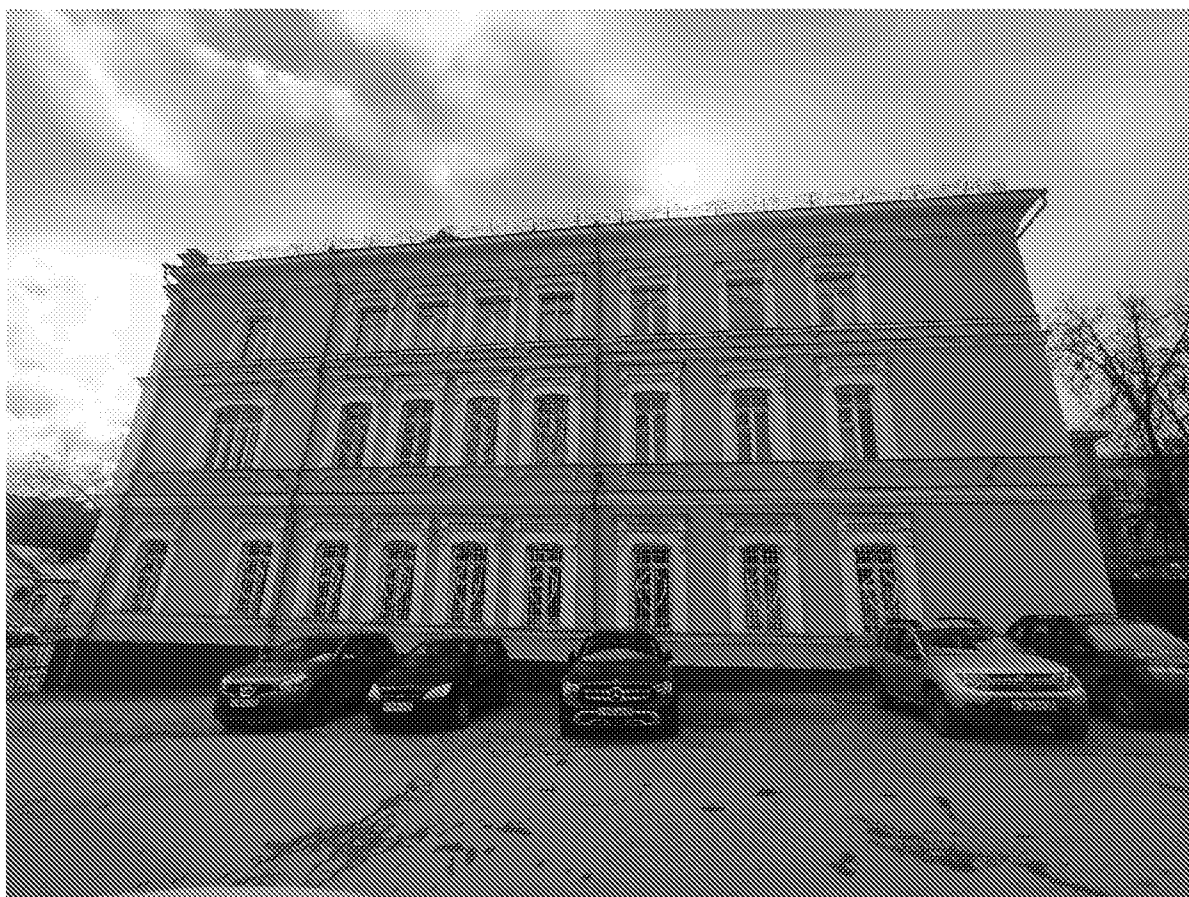
Фрагмент дворового фасада объекта культурного наследия