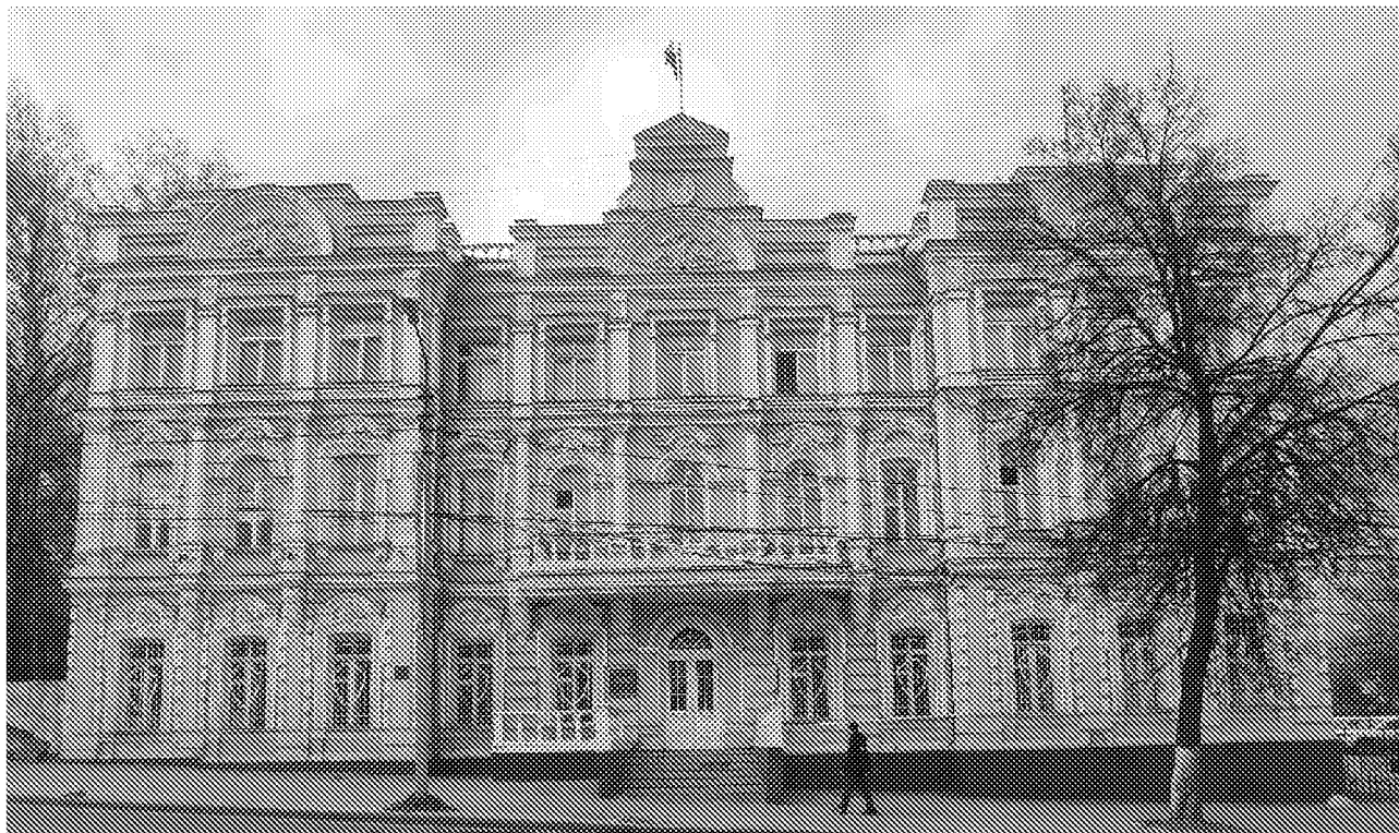
Вид на главный фасад объекта культурного наследия