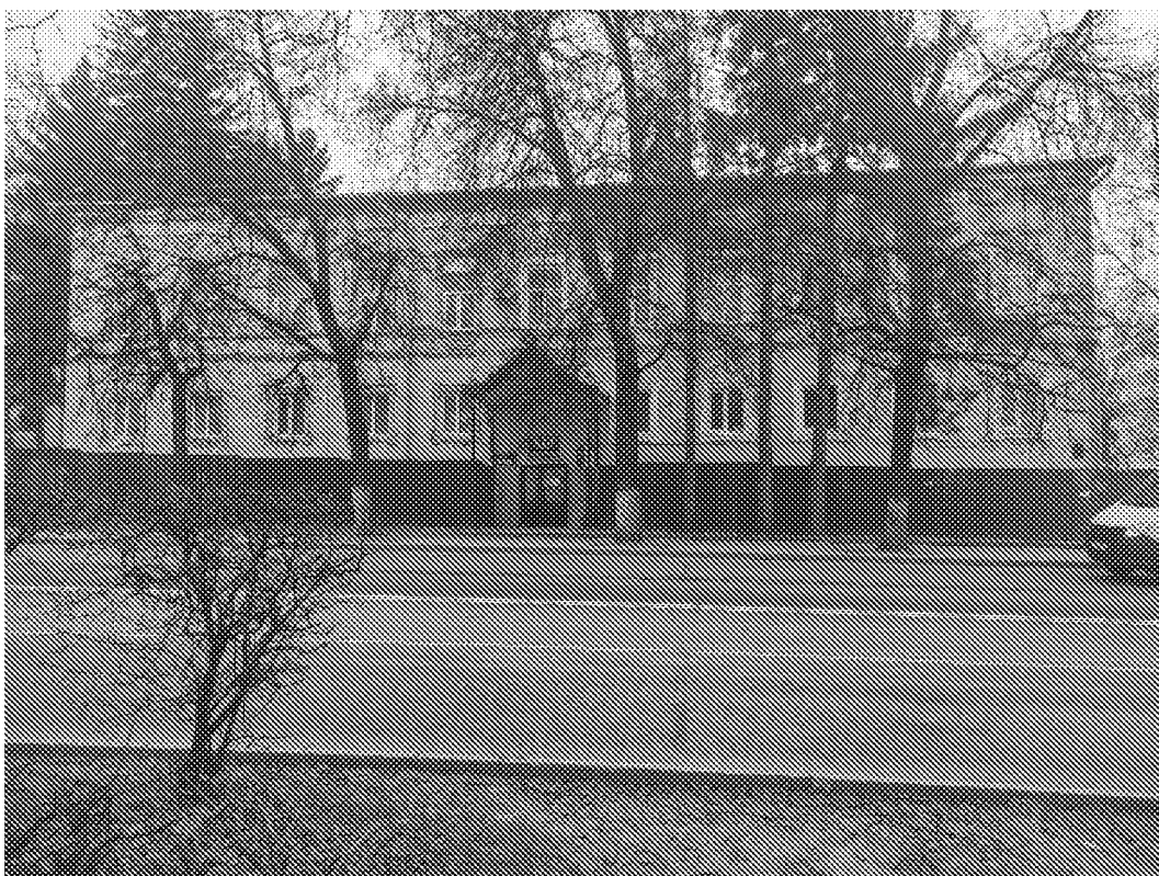
Вид на главный фасад объекта культурного наследия