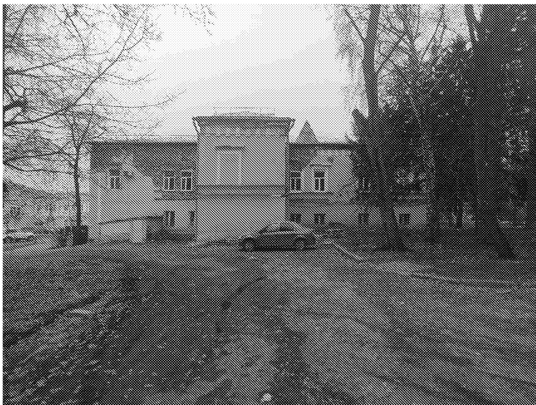
Фрагмент дворового фасада объекта культурного наследия