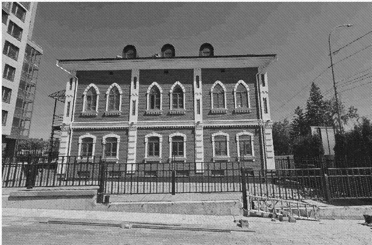
Общий вид объекта культурного наследия. Южный фасад

Фотографическое изображение объекта культурного наследия «Дом жилой» (Пензенская область, г. Пенза, ул. Урицкого, 56) (адрес в соответствии с Единым государственным реестром недвижимости: Пензенская область, г. Пенза, ул. Урицкого, 56А)