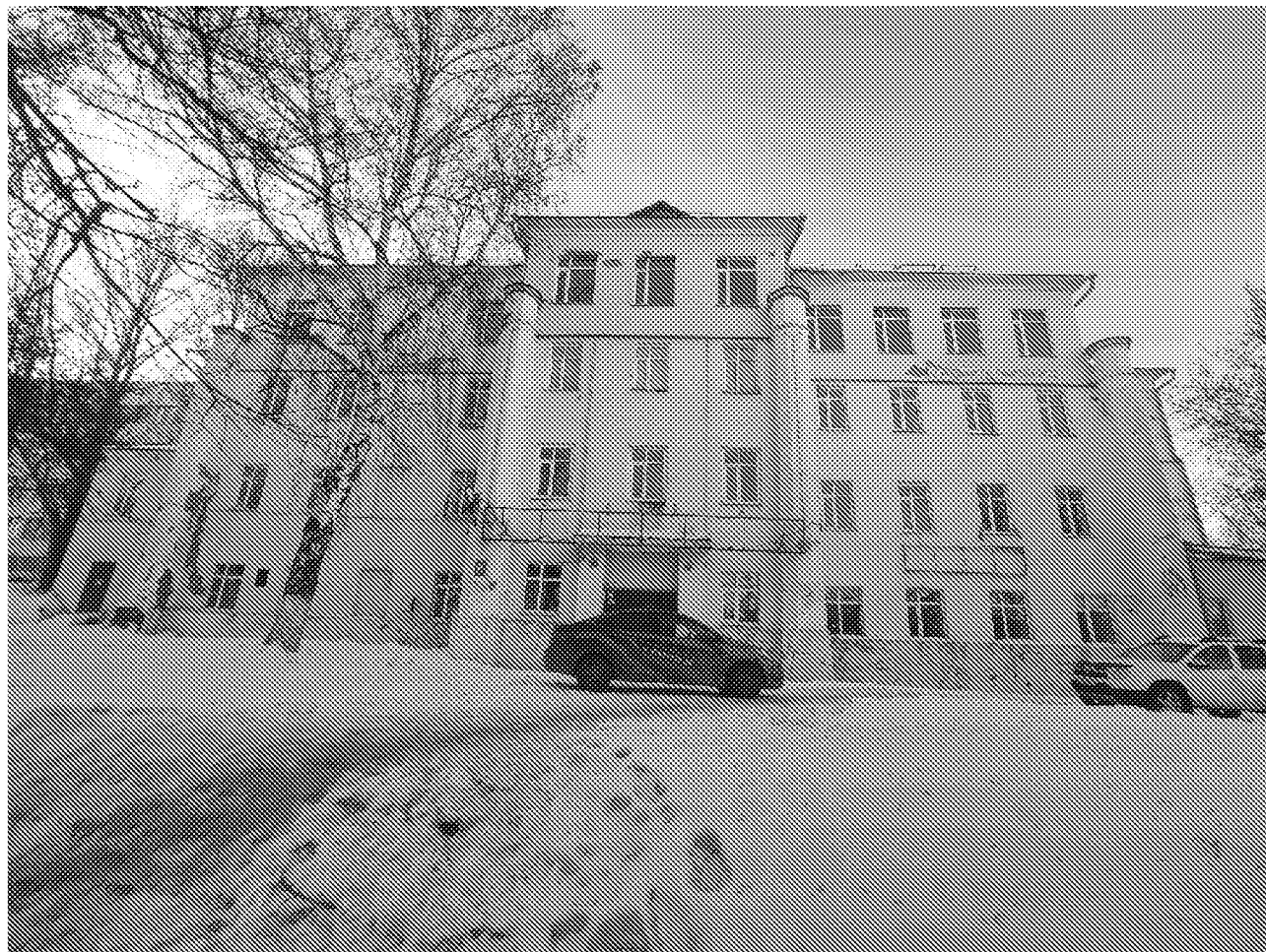
Вид на главный фасад объекта культурного наследия