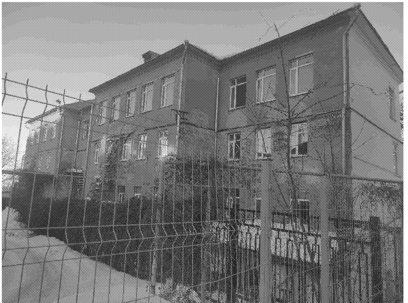
Фрагмент дворового (западного) фасада объекта культурного наследия