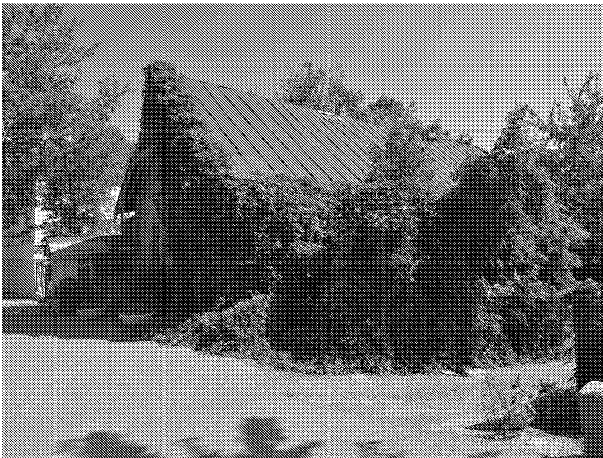
Вид на объект культурного наследия с юго-западной стороны