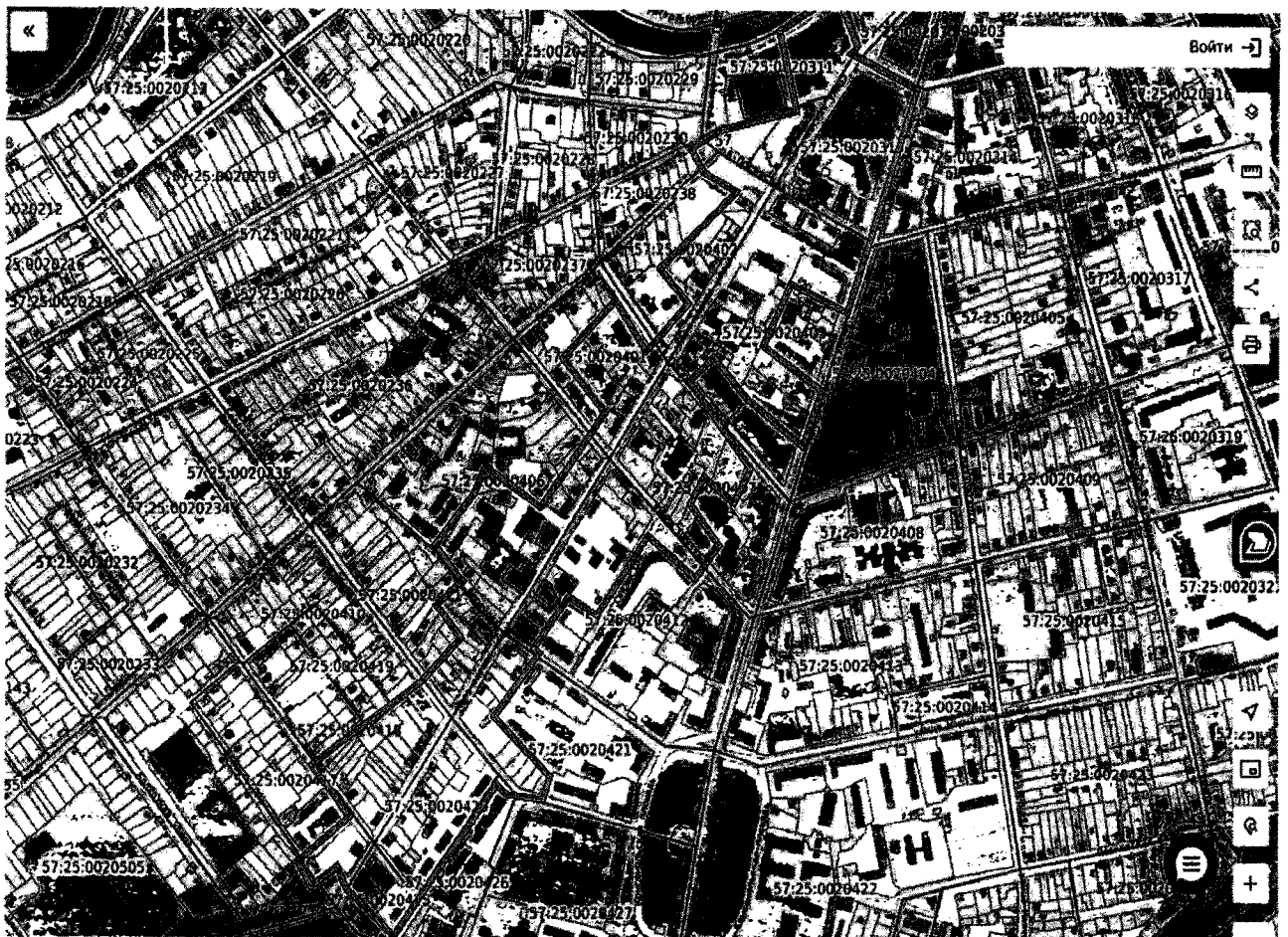
Схема размещения выявленного объекта культурного наследия «Достопримечательное место «Карачевская улица в г. Орле»

5) Приложение изложить в следующей редакции: