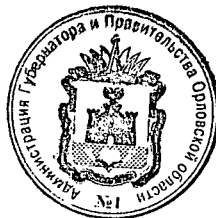
Ю. Н. Савенков

Временно исполняющий обязанности Губернатора Орловской области