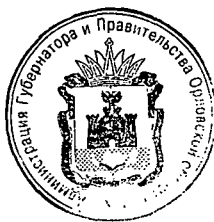
В. А. Тарасов

Временно исполняющий обязанности Губернатора Орловской области