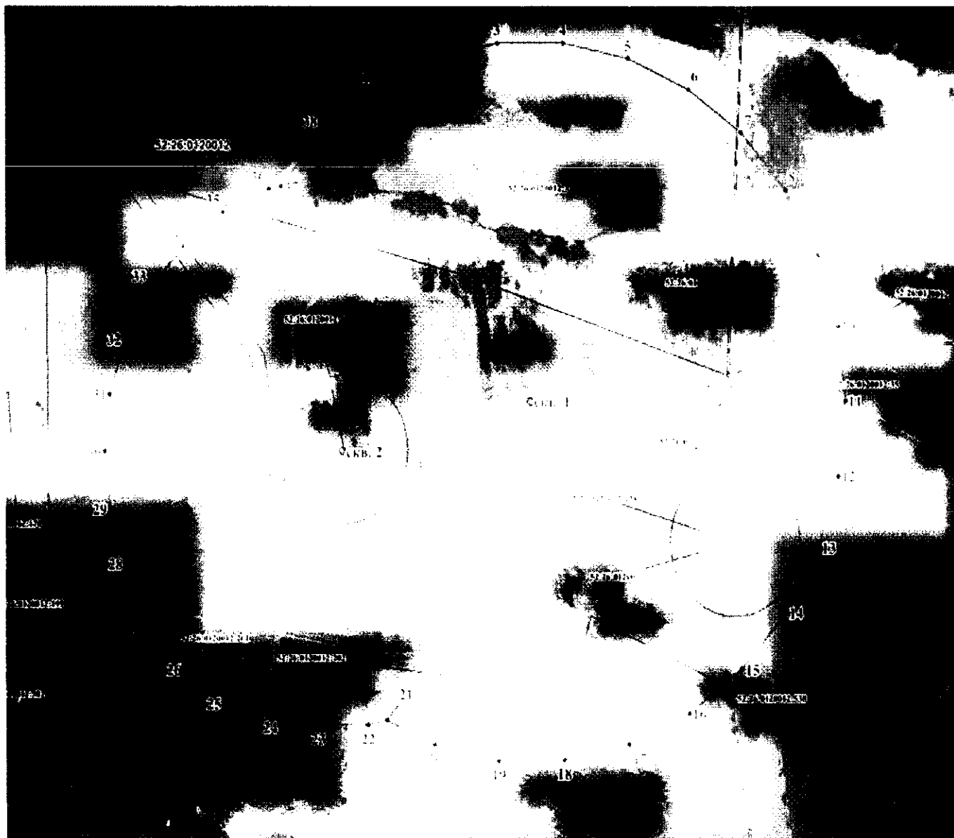
Координаты характерных точек границ третьего пояса ЗСО водозаборного участка АО «Нижегородский водоканал» в с. Запрудное Кстовского муниципального округа Нижегородской области

Размеры границ третьего пояса ЗСО скважин № 1 и № 2 определены в результате гидродинамических расчетов. Границы третьего пояса общие, представляют собой пересекающиеся окружности, размеры которых составляют: 242,0 метра (для скважины № 1), 185,0 метров (для скважины № 2). Скважины расположены в центрах соответствующих окружностей.