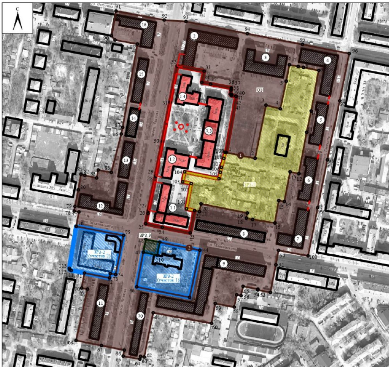
Схема границ зон охраны объекта культурного наследия регионального значения «Ансамбль жилых домов с курдонером» (Нижегородская область, город Дзержинск, проспект Чкалова, 12, 14, 16, 18)

к постановлению Правительства Нижегородской области от 27.02.2026 № 73