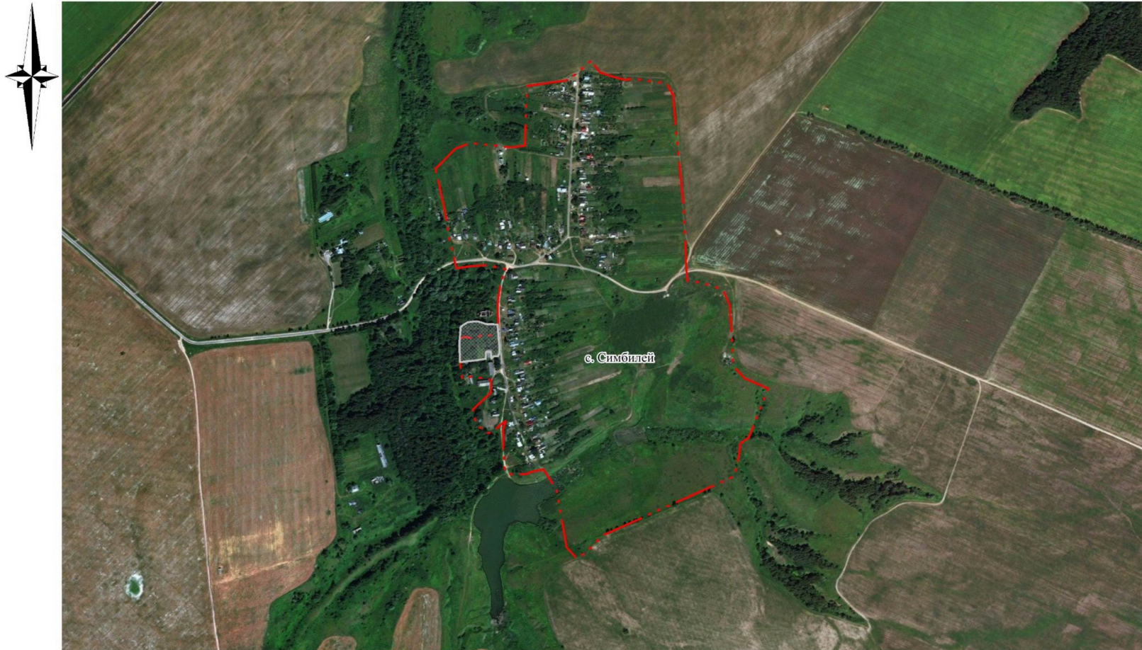
СХЕМА ГРАНИЦ ПАМЯТНИКА ПРИРОДЫ РЕГИОНАЛЬНОГО ЗНАЧЕНИЯ "ПАРК С. СИМБИЛЕЙ"