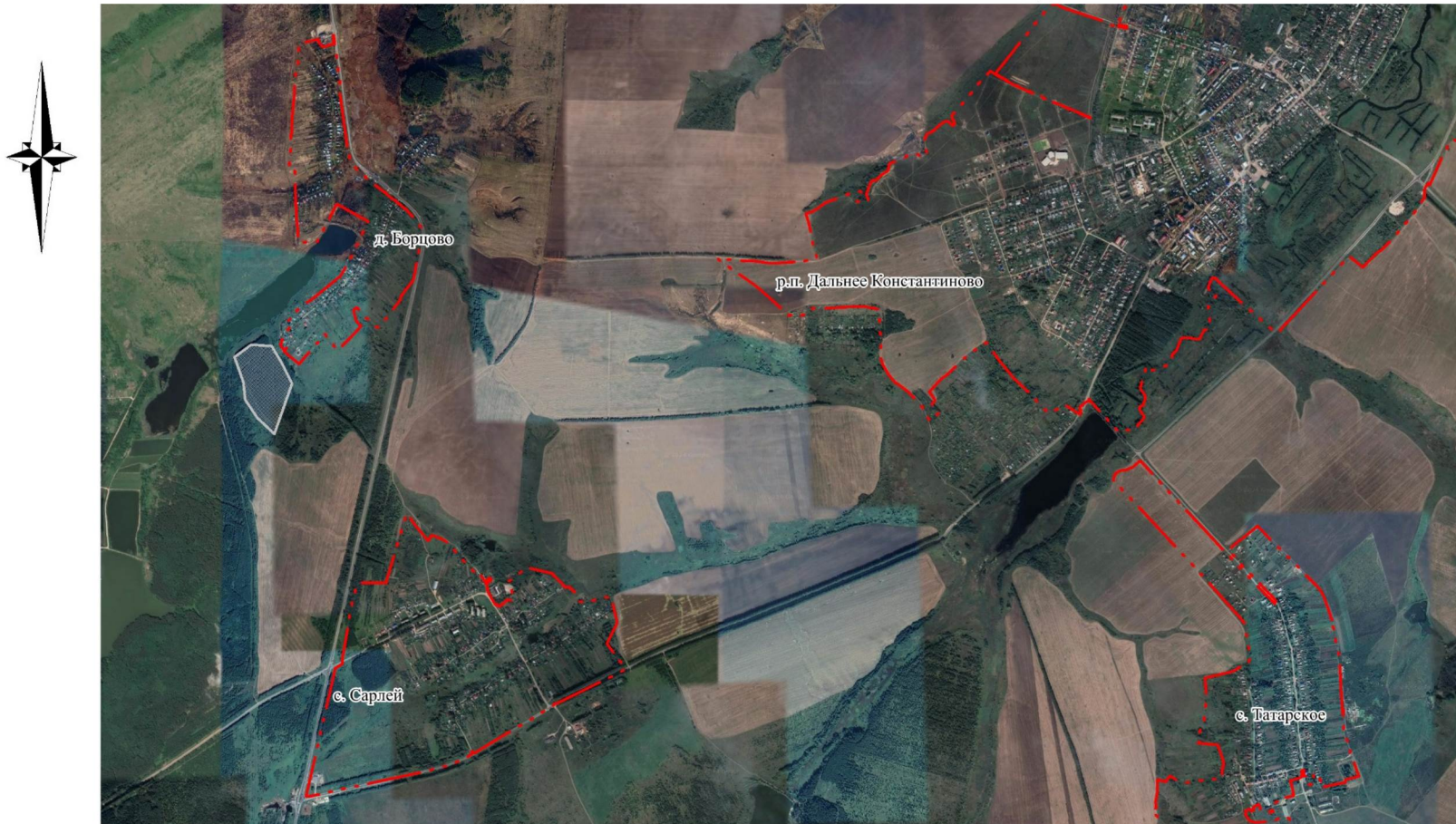
СХЕМА ГРАНИЦ ПАМЯТНИКА ПРИРОДЫ РЕГИОНАЛЬНОГО ЗНАЧЕНИЯ "ЛЕСНОЕ УРОЧИЩЕ "ГАРИ" БЛИЗ С. САРЛЕЙ"